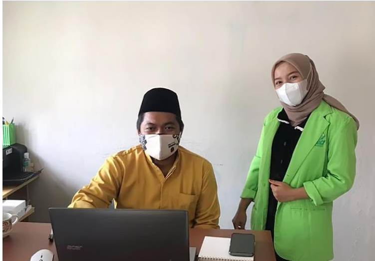
Lampiran 1. Foto Bersama Sekretaris Desa Kumpai Batu Atas