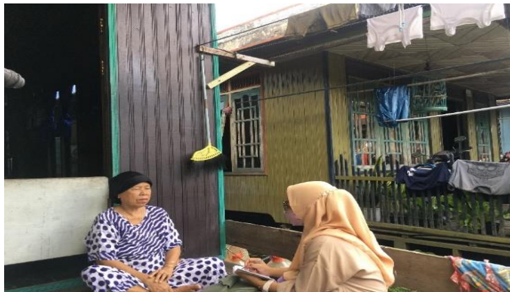
Lampiran 2 Foto Wawancara Bersama Ibu MN (K3)