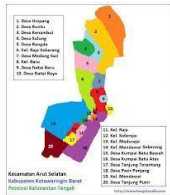
Gambar 4. 2 Letak Geografis Desa Kumpai Batu Atas