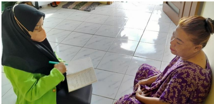
Lampiran 4 Foto Wawancara Bersama Ibu SI (K1)