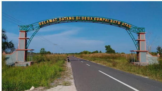
Gambar 4. 1 Gapura Desa Kumpai Batu Atas

Desa Kumpai Batu Atas merupakan salah satu desa yang ada di wilayah Kecamatan Arut Selatan, Kabupaten Kotawaringin Barat, Provinsi Kalimantan Tengah. Desa Kumpai Batu Atas merupakan salah satu desa yang adadiwilayah Kecamatan Arut Selatan, Kabupaten Kotawaringin Barat, Provinsi Kalimantan Tengah. Jumlah penduduk di Desa Kumpai Batu Atas mencapai 3260 jiwa, dengan berkisar 1980 orang laki-laki dan 1280 perempuan. Luas seluruh wilayah Desa Kumpai Batu Atas yaitu 3210 m 2 . Penggunaan lahan terbesar pada sektor pertanian. Mayoritas dari penduduk Desa Kumpai Batu Atas bermata pencaharian sebagai petani dan pedagang. Jumlah petani di desa Kumpai Batu Atas kurang lebih sebanyak 780 orang. Sedangkan, yang bermata pencaharian sebagai pedagang kurang lebih sebanyak 658 orang. 62