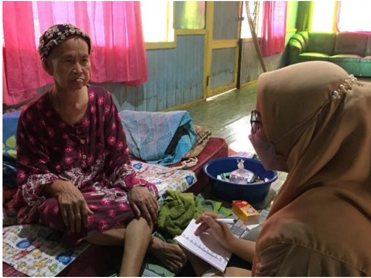
Lampiran 3 Foto Wawancara Bersama Ibu UG (K2)