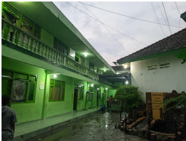
Suasana di dalam Pondok pesantren At-Tanwir