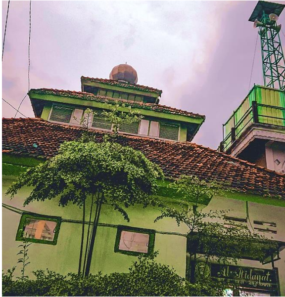
Masjid Pondok Pesantren At-Tanwir