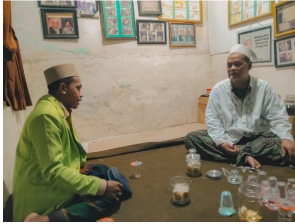
Wawancara Kepada Ustaz Pengajar Kitab Rislatu Asy-Syafiyah kelas 1 dan 2 MTs