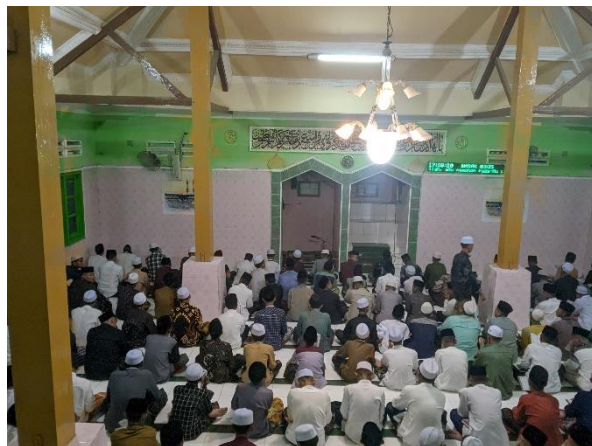
Kegiatan Santri di Dalam Masjid