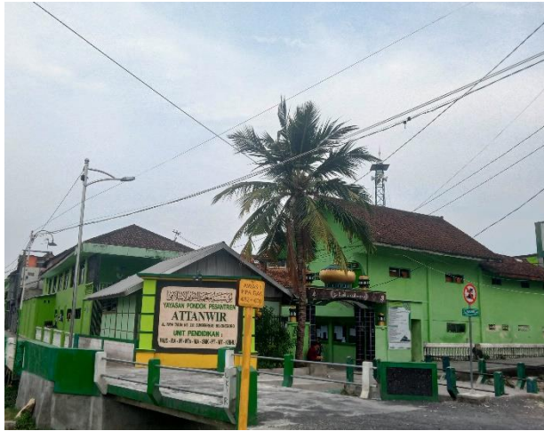
Lokasi Pondok Pesantren At-Tanwir Bojonegoro