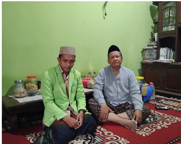
Wawancara Kepada Pembimbing Pondok Pesantren At-Tanwir