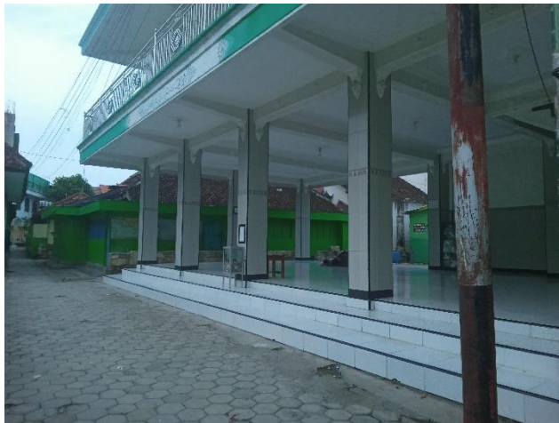
Tempat Pembelajaran Kitab Risalatul Asy-Syafiyah