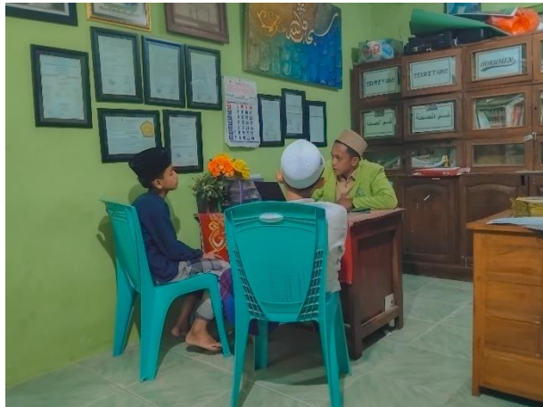
Wawancara Kepada Santri Kelas 1 MTs