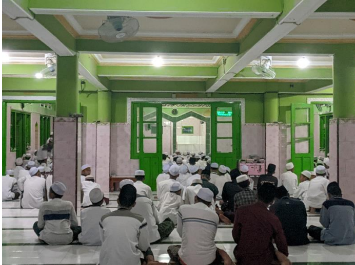
Kegiatan Setelah Sholat Berjama'ah Santri