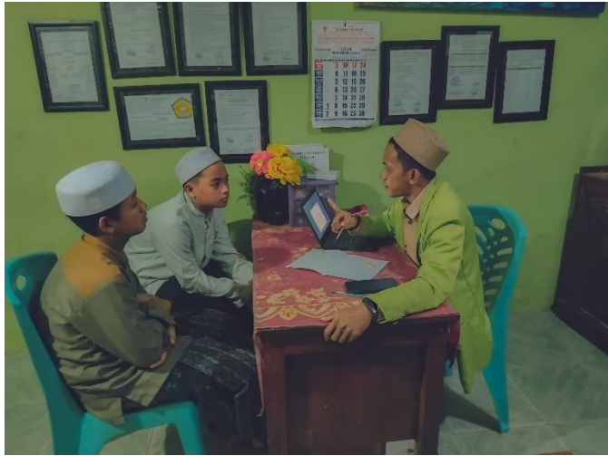
Wawancara Kepada Santri Kelas 2 MTs