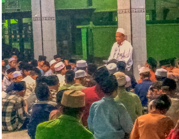
Proses Pembelajaran kitab Rislatu Asy-Syafiyah