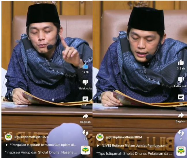
Gambar Channel Gus Iqdam di Youtube tentang Keutamaan Sholat Dhuha