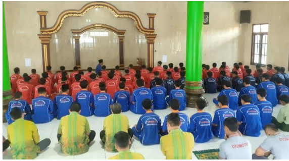
Gambar Kegiatan Pembiasaan Sholat Dhuha