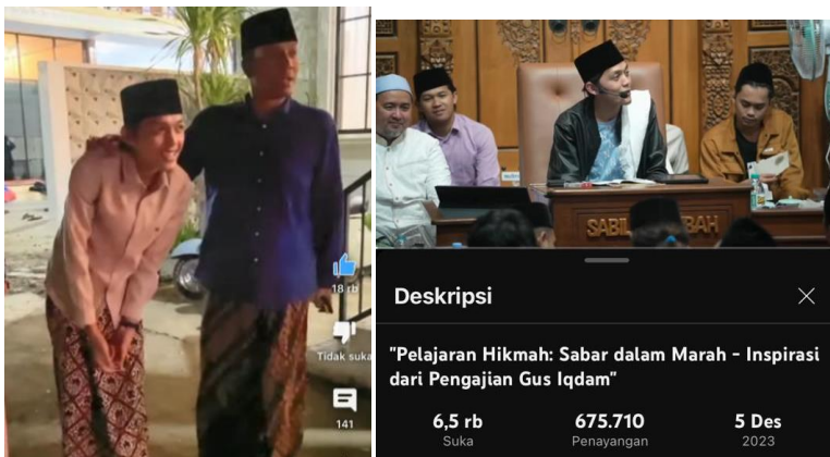
Gambar Channel Gus Iqdam di Youtube tentang pentingnya menjaga perilaku