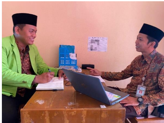
Gambar wawancara dengan Guru PAI