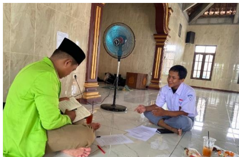
Gambar wawancara dengan siswa SMK YATPI Godong