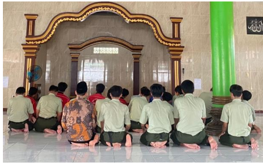
Gambar Kegiatan Sholat Dzuhur Berjamaah