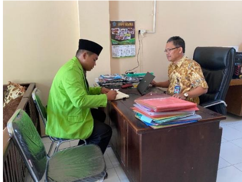
Gambar wawancara dengan Kepala Sekolah