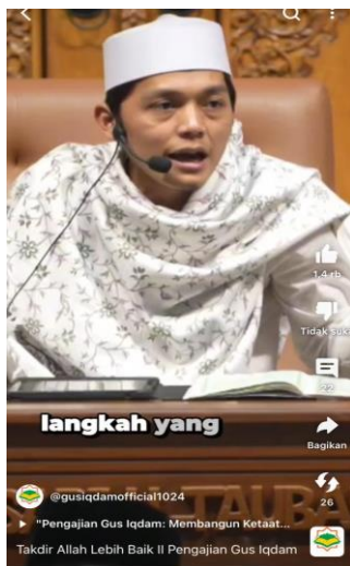
Gambar Chnnel Gus Iqdam di Youtube tentang ketaqwaan dan mensyukuri nikmat Allah