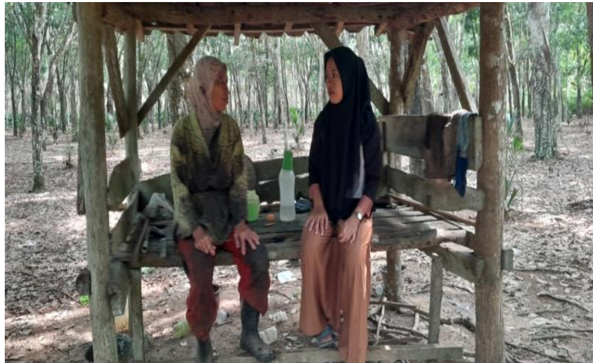
Gambar 3.7 Wawancara bersama petani karet