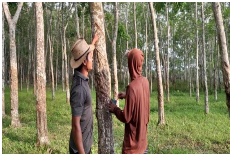
Gambar 3.4 Contoh pengaplikasian obat jamur oleh petani karet bersama pihak PPL

“untuk mengobati Kering Alur Sadap yang disebabkan oleh jamur maka diperlukan Fungisida yang berbahan aktif Mancozeb dengan merek dagang Cozone”