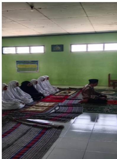
Sholat Dhuhur Berjama'ah