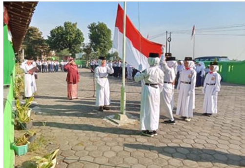
Kegiatan Upacara Bendera