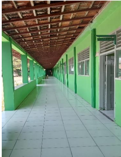
Kondisi Di Luar Kelas