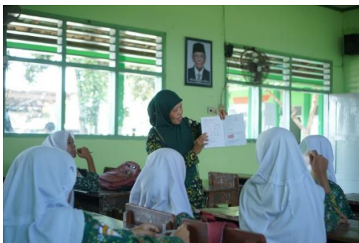
Kegiatan Ekstra Menjahit