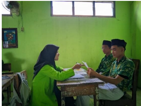
Wawancara dengan Siswa Kelas IXB