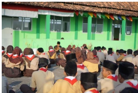
Pembacaan Tahlil Bersama