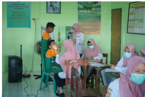
Cek Kesehatan Siswa Siswi MTs NU 05 SUKA Kaliwungu