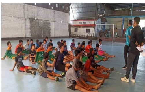
Kegiatan Ekstra Badminto