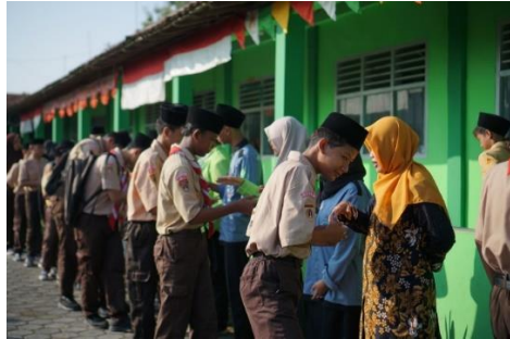
Pembiasaan Senyum, Salam, Sapa