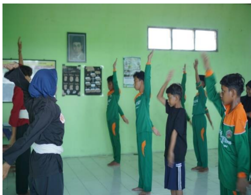
Kegiatan Ekstra Pencak Silat