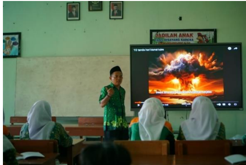
Proses Belajar dengan Guru Akidah Akhlak