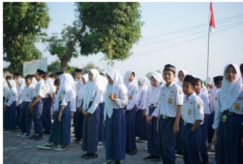
Persiapan Pembacaan Asma'ul Husna