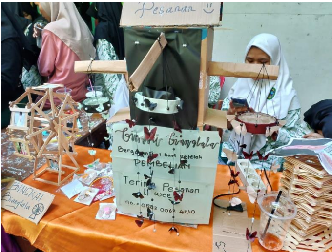
Gambar III.10 Dokumentasi projek tahunan Maulid Nabi pada hari kedua