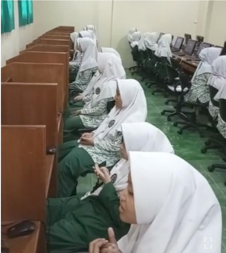
Gambar III.2 Dokumentasi pembacaan doa sa'altu oleh siswa MA Futuhiyyah 2 Mranggen Demak