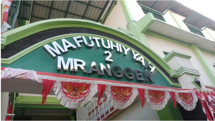
Gambar II.2 Gedung MA Futuhiyyah 2 Mranggen Demak tampak depan