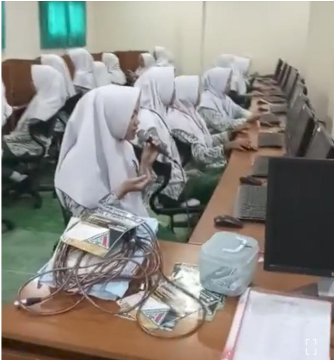
Gambar III.1 Dokumentasi pembacaan doa sa'altu