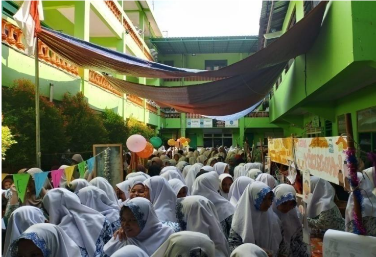
Gambar III.9 Dokumentasi projek tahunan Maulid Nabi pada hari kedua