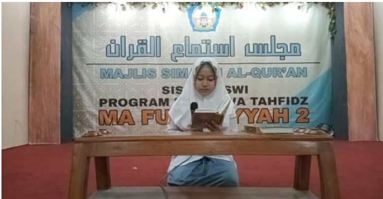
Gambar III.4 Dokumentasi pembacaan Al-Qur'an, Tahlil, dan Manaqib oleh siswi MA Futuhiyyah Mranggen Demak