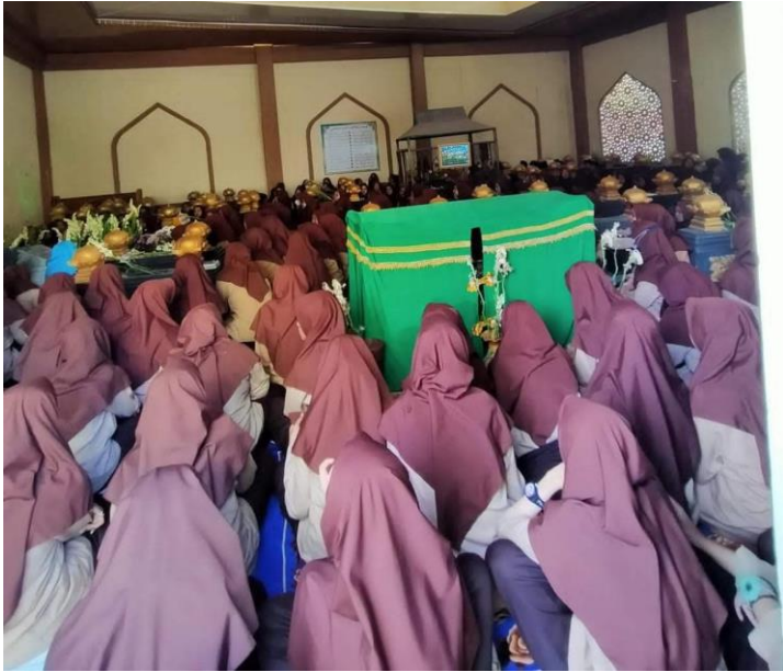
Gambar III.7 Dokumentasi ziarah kubur yang dipimpin oleh guru SKI di MA Futuhiyyah 2 Mranggen Demak