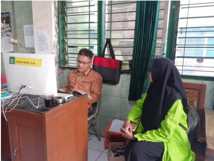
Gambar II.3 Bukti penyerahan surat izin penelitian kepada wakil kepala madrasah bagian humas