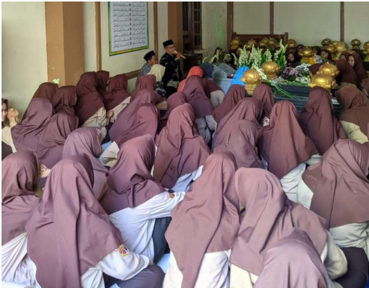
Gambar III.6 Dokumentasi ziarah kubur yang dipimpin oleh guru SKI di MA Futuhiyyah 2 Mranggen Demak