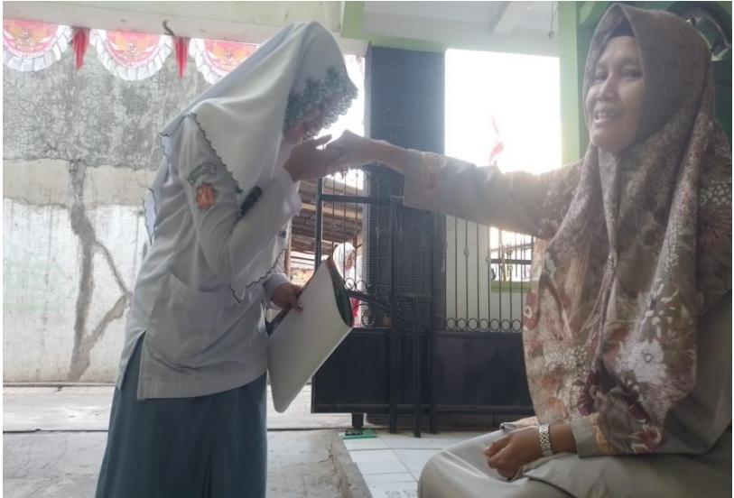
Gambar III.3 Dokumentasi adab Islami yang ada di MA Futuhiyyah 2 Mranggen Demak