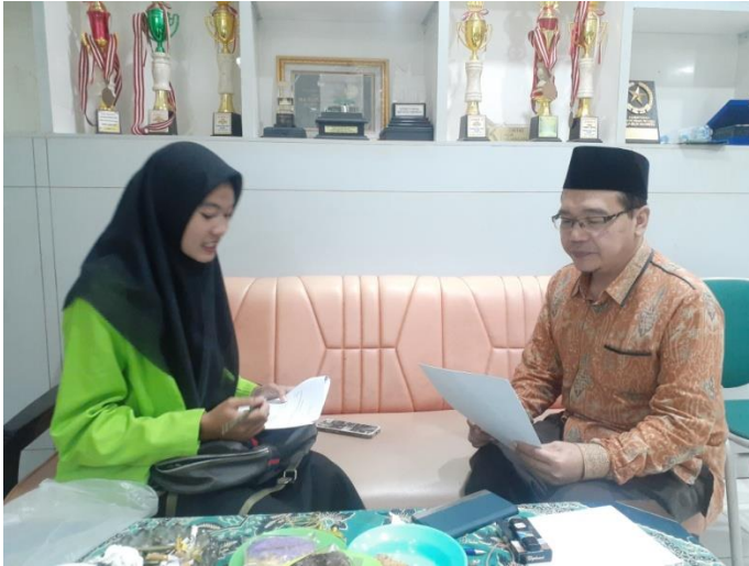
Gambar II.4 Wawancara dengan wakil kepala madrasah bagian kurikulum MA Futuhiyyah 2 Mranggen Demak