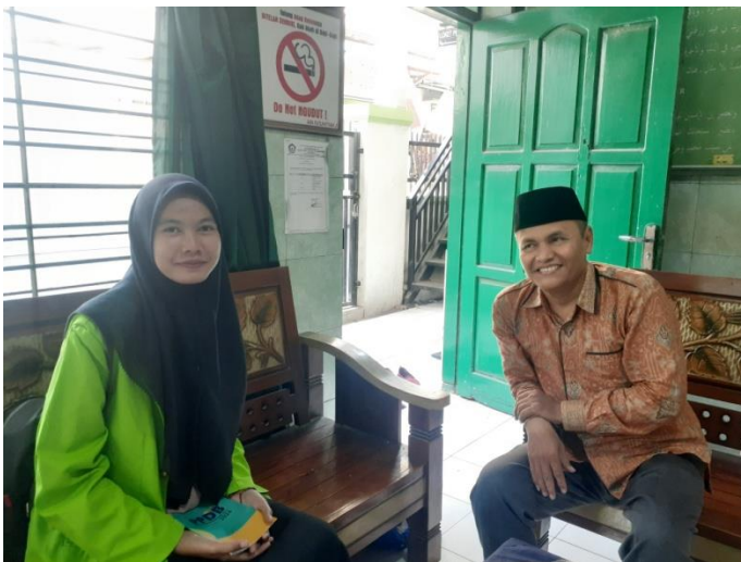
Gambar II.5 Wawancara dengan guru Sejarah Kebudayaan Islam Ma Futuhiyyah 2 Mranggen Demak