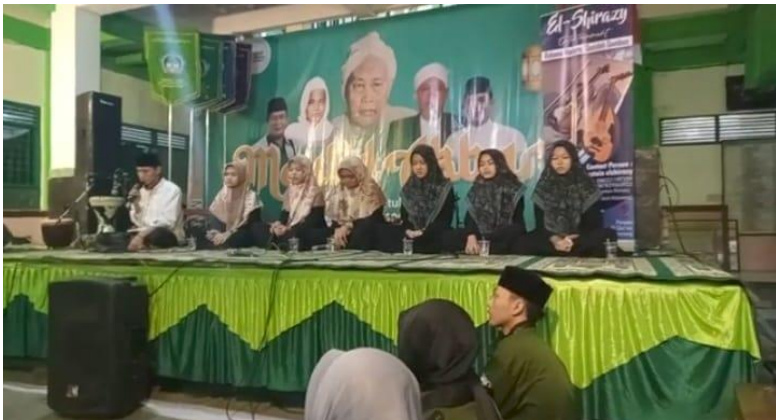
Gambar III.8 Dokumentasi projek tahunan Maulid Nabi pada hari pertama