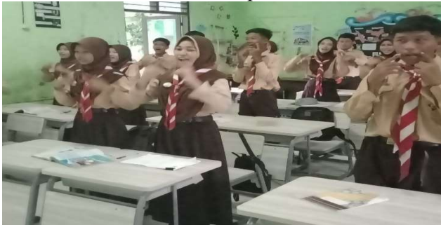
Pembiasaan Salam PPK