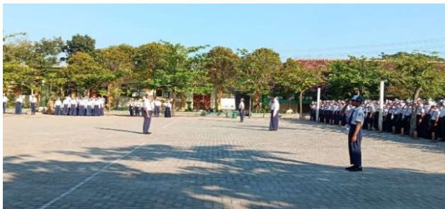
Upacara Bendera Hari Senin