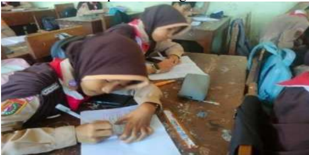
Siswa sedang menyelesaikan tugasnya sendiri (mandiri)