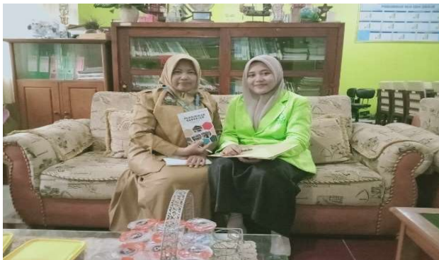
Wawancara dengan Kepala Sekolah SMP Negeri 1 Lasem