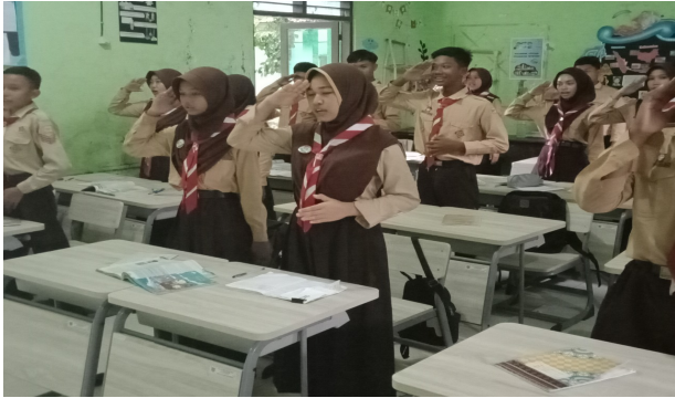
Pembiasaan Tepuk PPK