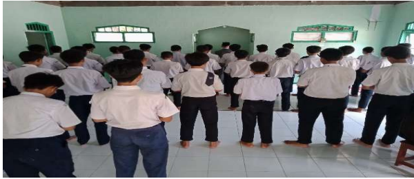
Salat Jama'ah Dhuhur