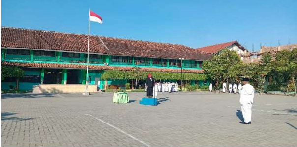
Upacara 17 Agustus