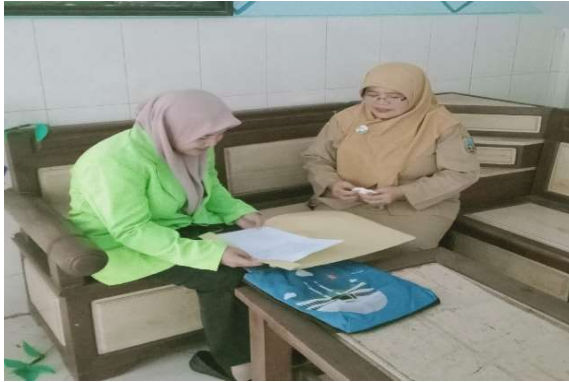
Wawancara dengan Guru