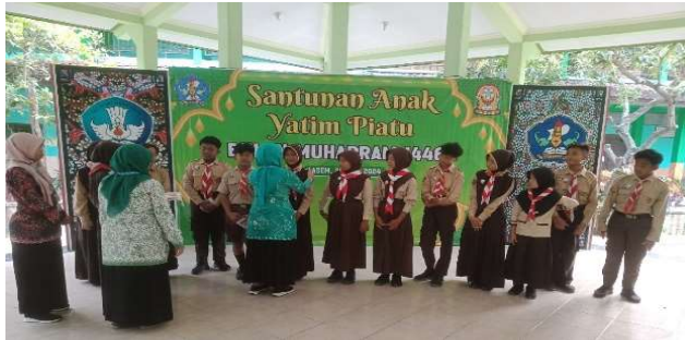
Santunan Anak Yatim Piatu