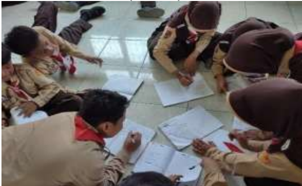
Siswa sedang menyelesaikan tugas diskusi kelompok