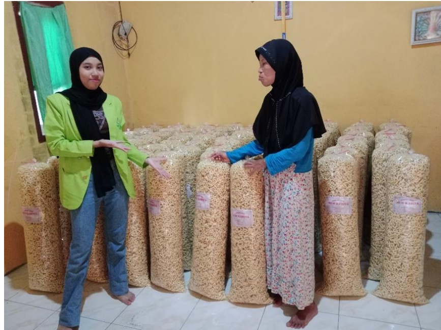
Gambar 4: Gambar wawancara pemilik UMKM lanting