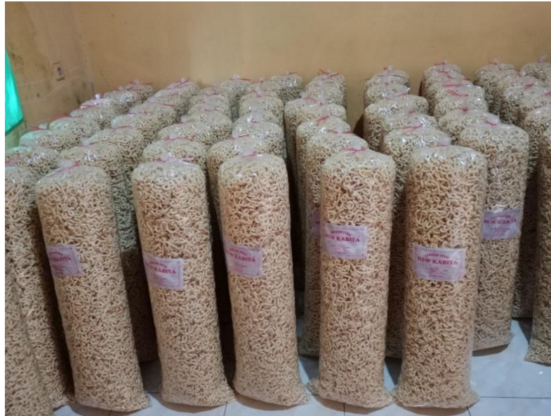
Gambar 3.4 kemasan lanting

dari produksi singkong 1 kg sampai sekarang yang dapat mencapai produksi 1 kwintal. Dari penggunaan alat yang masih tradisional sekarang berkembang menggunakan mesin dan alat yang lebih canggih. Dari variasi rasa yang dulunya hanya original saja sekarang sudah ada rasa bawang, pedas manis, jagung dan merah putih.