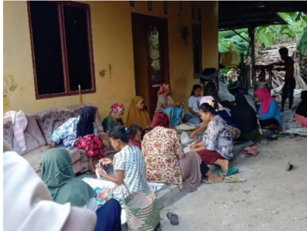
Gambar 3.7 kegiatan bundel atau membuat lanting menjadi angka delapan

“biasanya yang bundel itu ya orang desa sini yang banyak mba, tapi terkadang ada mba yang dari desa tetangga ke sini pagi-pagi, sebelum subuh kadang mereka udah pada disini mba”.