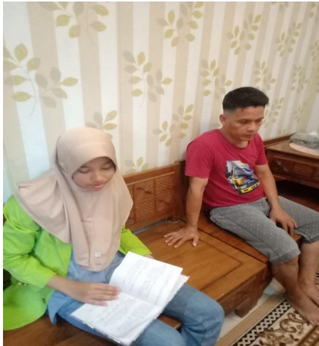
Gambar 6: Gambar wawancara dengan masyarakat