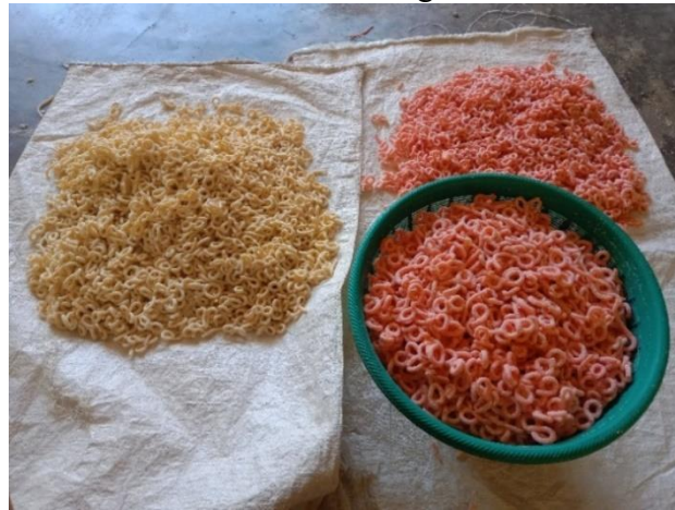
Gambar 3.5 takaran lanting