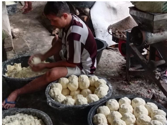
Gambar 3.6 proses blondoni

Pada gambar 3.5 dapat dilihat gambar ewed. Ewed yaitu lanting yang belum digoreng dan setiap masyarakat yang sudah selesai ditakar menggunakan takaran seperti di atas dan dihitung hasilnya. Satu takaran senilai Rp. 3.000.000 kemudian dikalikan dengan perolehan hasilnya.