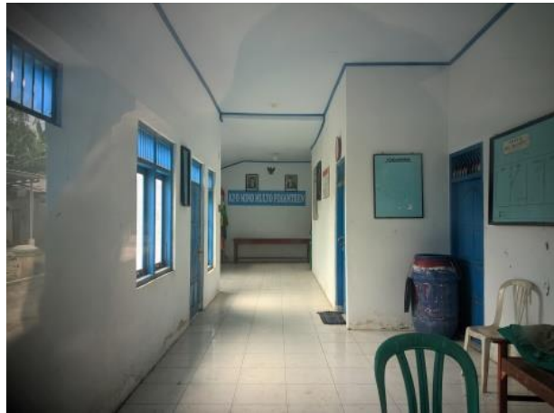
Gambar 6. Kantor KPD Desa Pesantren