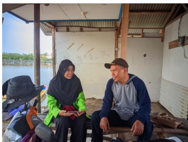
Gambar 10. Proses Wawancara bersama Petani Tambak