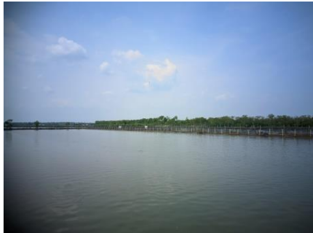
Gambar 7. Tambak milik Petani