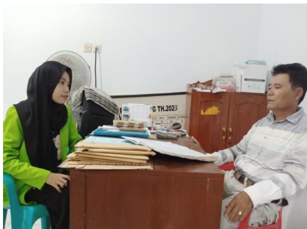
Gambar 9. Proses Wawancara bersama Juru Buku KPD Desa Pesantren