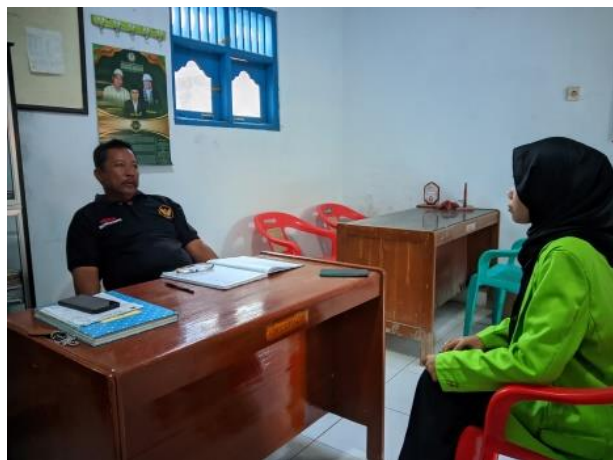
Gambar 8. Proses Wawancara bersama Sekertaris KPD Desa Pesantren