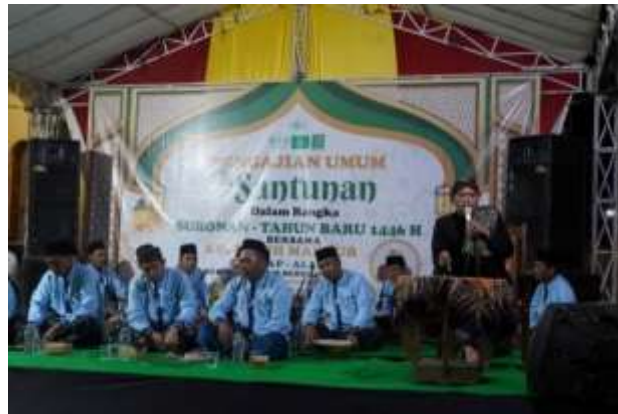
Gambar 7. Bantuan Sosial Keagamaan NU Care-LAZISNU dan Pengajian