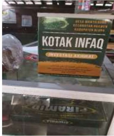
Gambar 3. Kotak Infaq (KOIN) NU Care-LAZISNU Desa Wantilung (Diletakkan di perumahan warga)