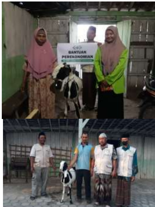
Gambar 8. Bantuan Ekonomi NU Care-LAZISNU Desa Wantilung

Program ekonomi selain dari pemberian modal usaha berupa kambing bergilir juga terdapat pendampingan bisnis mustahik. Dalam pendampingan bisnis mustahik, NU Care-LAZISNU Ranting Wantilung membanu mustahik dalam mengelola bisnis kecil dengan melalui pembimbingan pengelolaan keuangan sederhana dan pemasaran. Pendampingan ini mempunyai tujuan untuk meningkatkan pendapatan usaha mustahik.