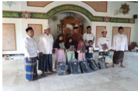
Gambar 5. Program bantuan penyaluran pendidikan