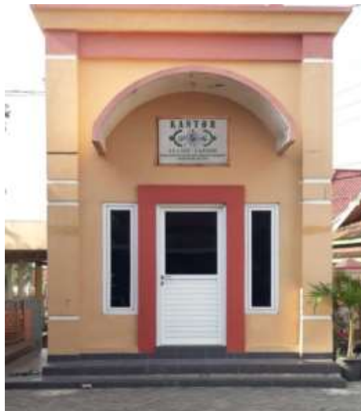
Gambar 19. Evaluasi tiap bulan oleh pengurus NU Care-LAZISNU Desa Wantilgung