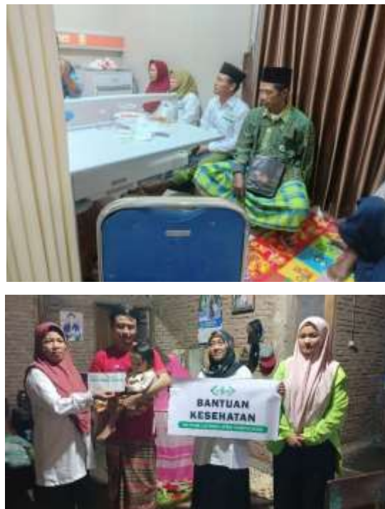
Gambar 6. Bantuan Program Kesehatan NU Care-LAZISNU Desa Wantilung

“Tidak hanya pada program pendidikan program-program lainnya juga seperti program kesehatan seperti memberikan tali asih, menjenguk, dan mengantar jemput bagi mustahik yang sakit dan tidak ada kendaraan untuk ke rumah sakit atau pukesmas. Menurut saya itu sudah membantu untuk meringankan beban atau keluarga yang sedang mengalami musibat (sakit)” (wawancara dengan Ibu Ika sebagai mustahik yang mendapatkan bantuan kesehatan dari NU Care-LAZISNU Desa Wantilung tanggal 04 November 2024 pukul 17.00).