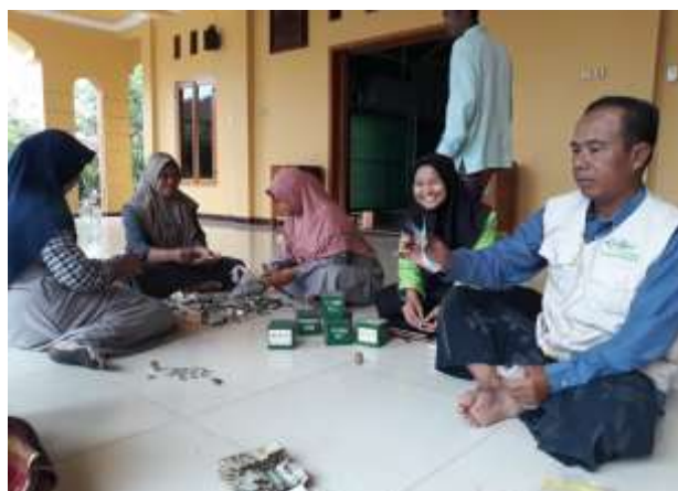
Gambar 4. Pengambilan sekaligus penghitungan kotak KOIN NU Care-LAZISNU Desa Wantilung

“Dari kami yang mempunyai tugas sebagai penyaluran dana dari kotak KOIN NU mempunyai strategi sendiri yakni pengambilan dilakukan pada akhir bulan di hari Jum’at dan dilakukan setelah jamaah ashar yakni pukul 16.00 di Masjid At- Thohirin karena menunggu jam kerja kantor maupun jam kerja lainnya selesai agar bisa semua pengurus dapat ikut berkumpul di masjid mbak. Setelah itu, dilakukan penghitungan KOIN NU secara bersama-sama dan dikumpulkan ke bendahara. KOIN NU tersebut digunakan untuk penyaluran 4 program yang ada dari NU Care-LAZISNU sendiri dan kotak KOIN NU langsung dikembalikan atau ditaruh kembali keruma mereka masing-masing dan toko yang ada di Desa Wantilung. Semua masyarakat berhak ada karena mereka yang meminta dengan sendirinya”. (wawancara dengan Bapak Lasminto sebagai penyaluran program NU Care-LAZISNU Desa Wantilung pada 5 November 2024 pukul 16.30).