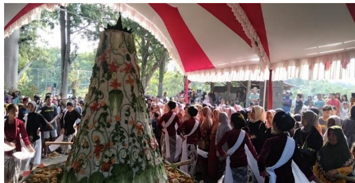
Gambar 3. 3 Prosesi Manganan di makam Mbah Mbolem tahun 2024