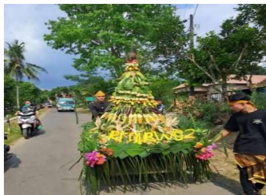
Gambar 3. 2 Arak-Arakan Tumpeng dari RT 01 RW 02 Tahun 2024