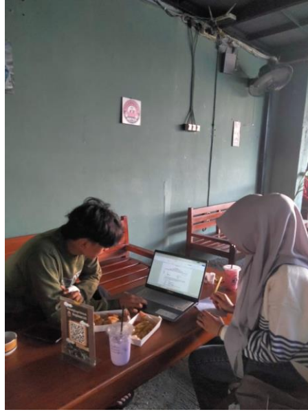
Gambar wawancara bersama panitia Festival Memeden Gadhu