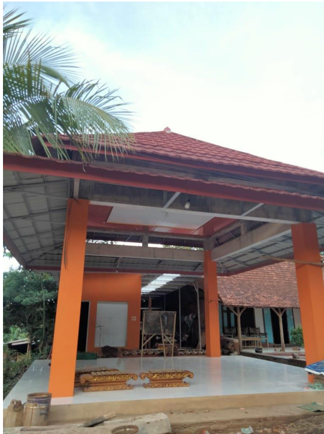
Gambar tempat sanggar