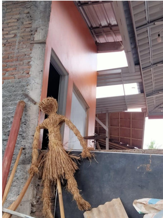
Gambar Patung Memeden Gadhu