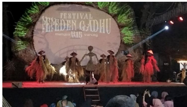
Gambar 3. 1 Penampilan Tari Kolosal Pada Tahun 2024