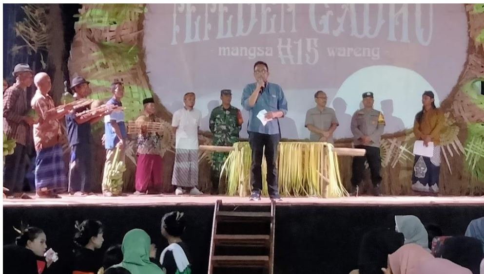
Gambar pembukaan kegiatan Tradisi Memeden Gadhu