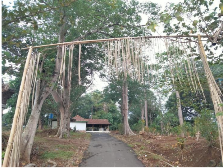
Gambar Tempat makam Mbah Mbolem