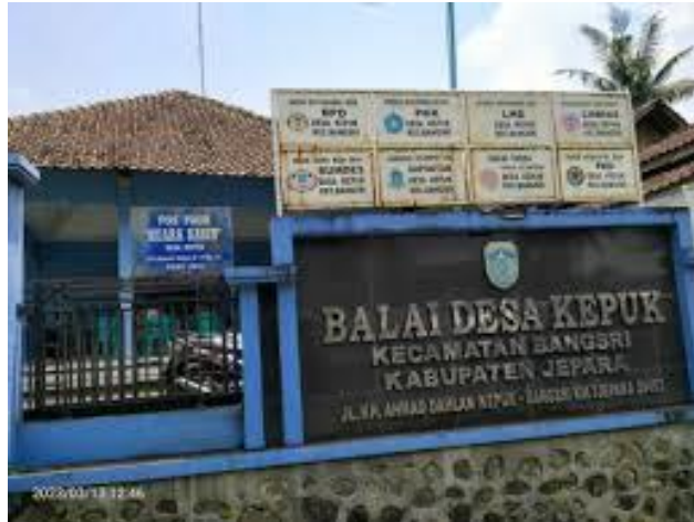
Gambar Balai desa Kepuk Kecamatan Bangsri Kabupaten Jepara