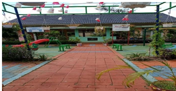
Gambar 10. Area Jogging Track

Berdasarkan pada gambar di atas adalah fasilitas pendukung yang tersedia di Taman RPTRA Kalideres ialah aula serbaguna, aula ini bisa digunakan untuk masyarakat yang berkegiatan secara indoor, seperti bimbel bahasa inggris, belajar bersama yang dilakukan anak-anak sekitar Taman RPTRA Kalideres, kegiatan seminar-seminar yang diselenggarakan dari Kelurahan Kalideres maupun dari luar, belajar seni tari, dan lainnya.