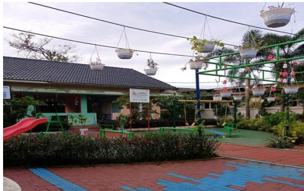
Gambar 2. Tampak Dalam Taman RPTRA Kalideres