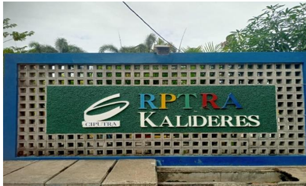
Gambar 1. Tampak Luar Taman RPTRA Kalideres

(RPTRA) ini, Gubernur DKI Jakarta Basuki Tjahaja Purnama (Ahok) berharap setiap kebutuhan anak-anak semakin terpenuhi agar mereka senang dapat berinteraksi dan bermain dengan bebas, aman, dan nyaman.