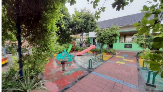
Gambar 16. Arena Bermain Anak