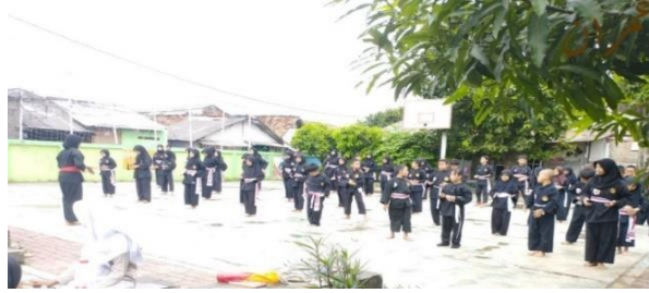
Gambar 19. Kegiatan Pencak Silat