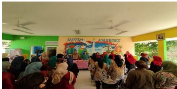
Gambar 20. Kegiatan Seminar untuk Ibu PKK