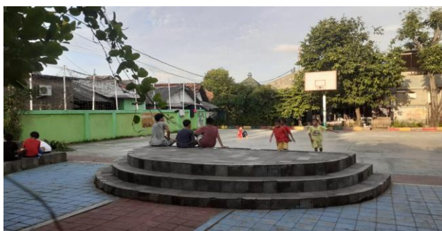
Gambar 13 . Lapangan Olahraga