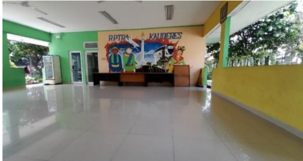
Gambar 9. Aula Serbaguna

ruangan ini, jadi para ibu bisa merasa aman dan nyaman saat menyusui anaknya.