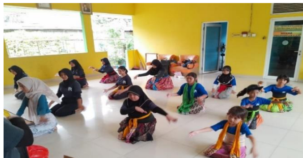
Gambar 18. Kegiatan Menari