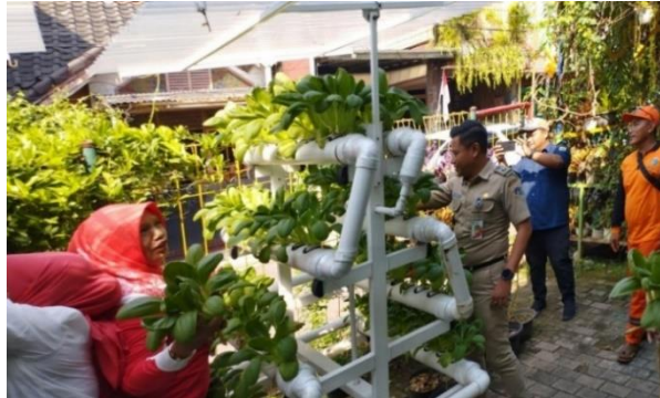
Gambar 15. Rak Bertanam Hidroponik