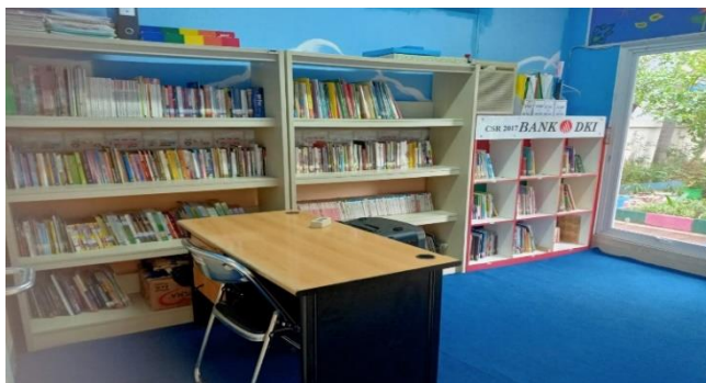
Gambar 12. Perpustakaan

Berdasarkan pada gambar di atas adalah fasilitas pendukung yang tersedia di Taman RPTRA Kalideres ialah area refleksi yang bisa digunakan untuk para lansia yang ingin berjalan sehat di tempat berbatuan.