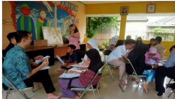
Gambar 17. Kegiatan Bimbel Bahasa Inggris