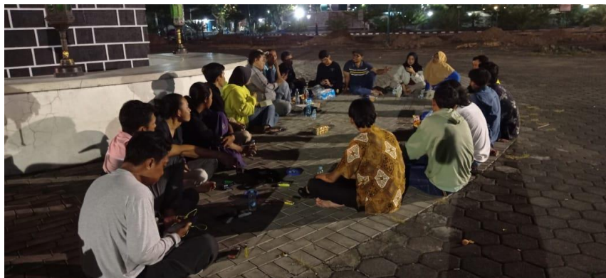
Gambar 4 Jamaah dan Penggiat Berdiskusi dalam Agenda Reboan