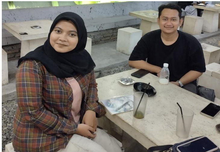
Lampiran 5. Wawancara dengan RA, jamaah Komunitas Gambang Syafaat