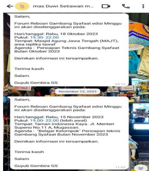
Gambar 3. Broadcast Penggiat Gombang Syafaat

Persiapan diskusi Komunitas Gombang Syafaat dibahas dalam agenda mingguan Gombang Syafaat yang disebut Reboan . Acara Reboan diadakan setiap satu minggu sekali pada hari Rabu malam dengan pembahasan yang berbeda di setiap minggunya. Agenda Reboan ini merupakan sebuah diskusi kecil yang biasanya hanya dihadiri oleh beberapa jamaah saja. Reboan biasanya diadakan di Masjid Agung Jawa Tengah tepatnya di Lapangan Monumen Ka'bah MAJT atau Kawasan Taman Indonesia Kaya dan dimulai dari pukul 19.00-22.00 WIB. Informasi mengenai agenda Reboan ini disampaikan melalui sosial media resmi milik Komunitas Gombang Syafaat dan grup whatsapp Komunitas Gombang Syafaat. Tak jarang, penggiat juga menyampaikan broadcast atau pesan siaran secara pribadi kepada jamaah Gombang Syafaat.