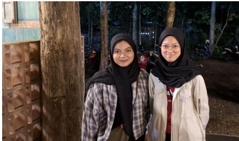
Lampiran 2. Wawancara dengan DI, penggiat Komunitas Gambang Syafaat