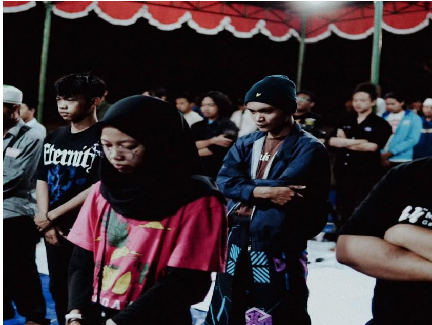
Gambar 11 Jamaah melantunkan shohibu baity