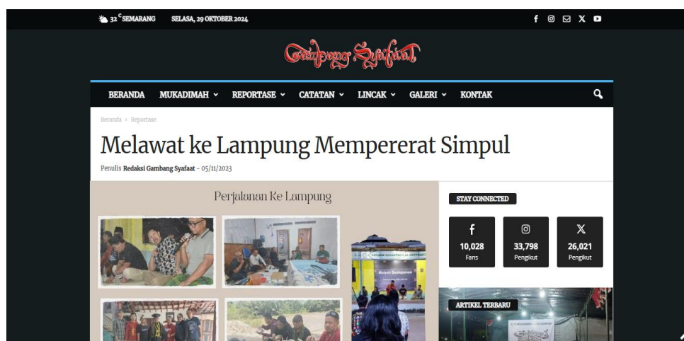
Gambar 19 Artikel Melawat Ke Lampung Mempererat Simpul

Contoh lain dari bentuk hubungan silaturahmi antar simpul maiyah juga dapat dilihat dari ketika ada salah satu penggiat simpul Maiyah Lampung atau biasa disebut Maiyah Dualapanan yang sedang merayakan pengukuhan guru besar. Seperti yang dilansir dalam artikel Gambang Syafaat yang berjudul “ Melawat Ke Lampung Mempererat Simpul ” (Redaksi Gambang Syafaat, 2023)