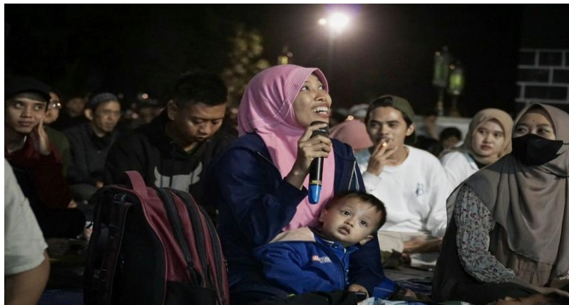
Gambar 8 Jamaah memberikan respon dalam sesi tanya jawab

Berdasarkan hasil wawancara dengan penggiat Gombang Syafaat, jamaah juga diperbolehkan untuk menanggapi pertanyaan atau respon dari jamaah lain. Hal tersebut dikarenakan konsep sinau bareng yang dimiliki oleh Gombang Syafaat bahkan.