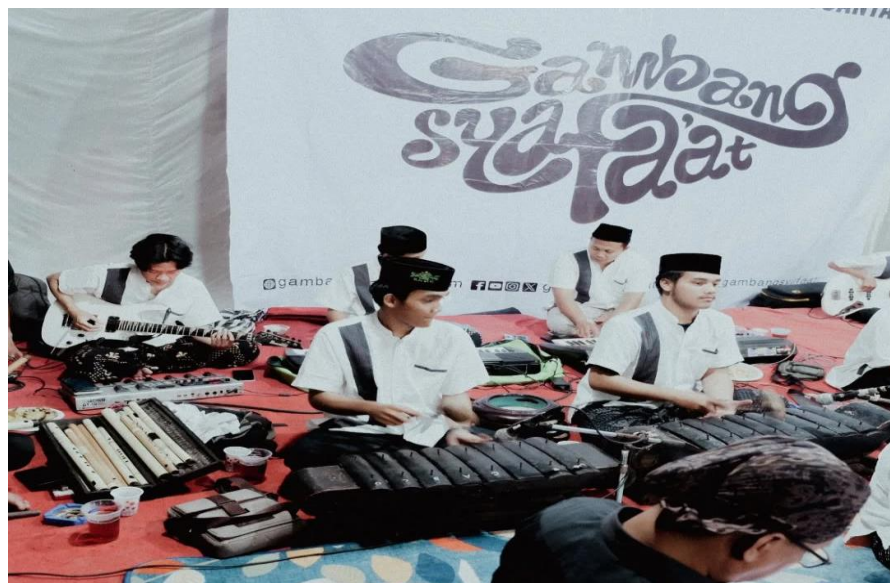
Gambar 10 Penampilan Seni Pada Diskusi Komunitas Gambang Syafaat

dengan cara penggiat biasanya mencari melalui Instagram , rekomendasi atau siapapun yang ingin tampil di setiap agenda Gambang Syafaat bisa menghubungi penggiat. Para penampil ini juga berasal dari berbagai kalangan. Mulai dari mahasiswa, jamaah hingga penggiat Gambang Syafaat sendiri.