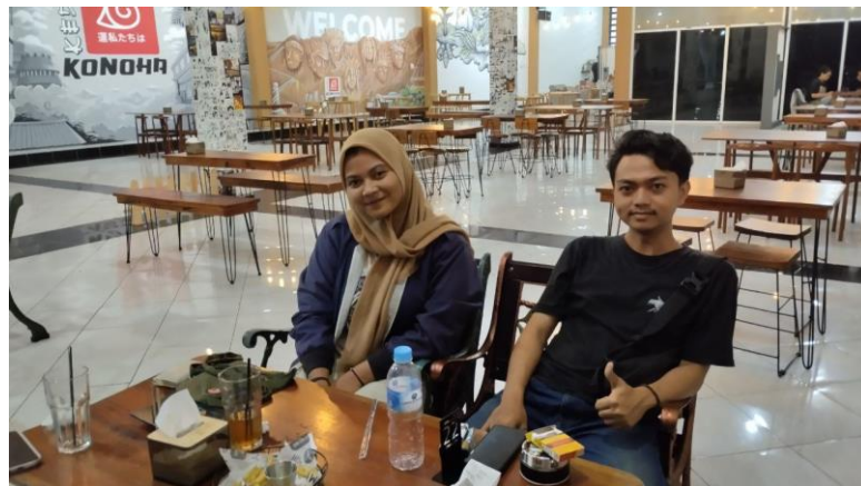
Lampiran 4. Wawancara dengan ZA, jamaah Komunitas Gambang Syafaat