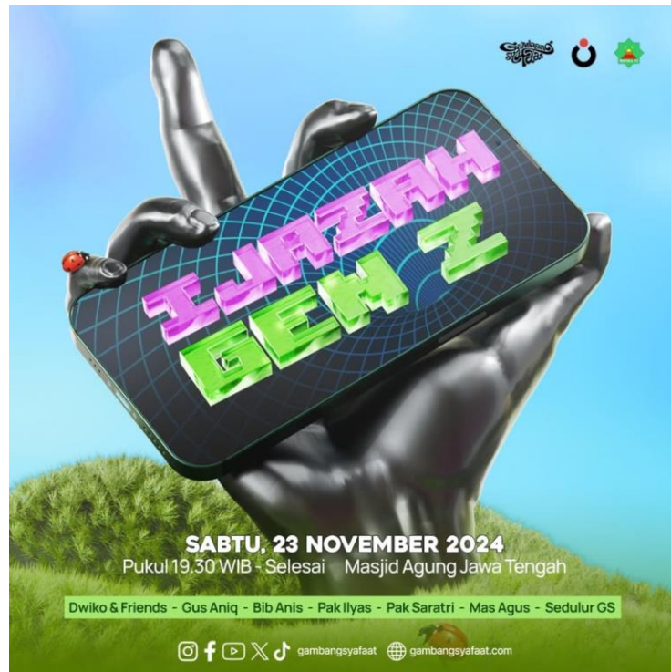
Gambar 14 Pamflet Gombang Syafaat