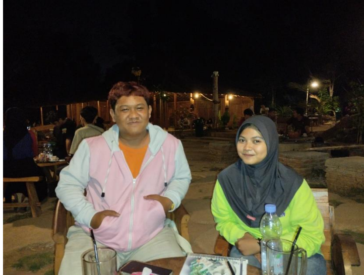
Lampiran 1. Wawancara dengan DS, penggiat Komunitas Gambang Syafaat