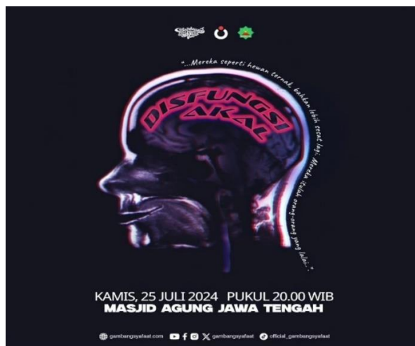
Gambar 5. Contoh Pamflet Kegiatan Diskusi

Berdasarkan hasil wawancara dengan penggiat Gombang Syafaat, pada awalnya informasi mengenai kegiatan Gombang Syafaat disampaikan dengan cara membagikan brosur. Brosur dibagikan di lampu merah ataupun ditempel di lingkungan masjid. Seiring berkembangnya teknologi, penyampaian informasi kegiatan Gombang Syafaat maka digunakanlah sosial media. Pamflet-pamflet tersebut disebarakan melalui akun sosial media resmi milik Gombang Syafaat seperti melalui story atau feeds instagram maupun twitter.