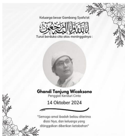
Sumber: Grup Whatsapp Gambang Syafaat