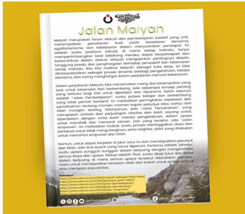
Gambar 6. Contoh Muqadimmah Gambang Syafaat