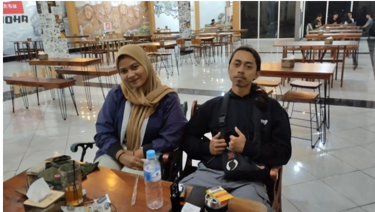
Lampiran 4. Wawancara dengan RD, jamaah Komunitas Gambang Syafaat