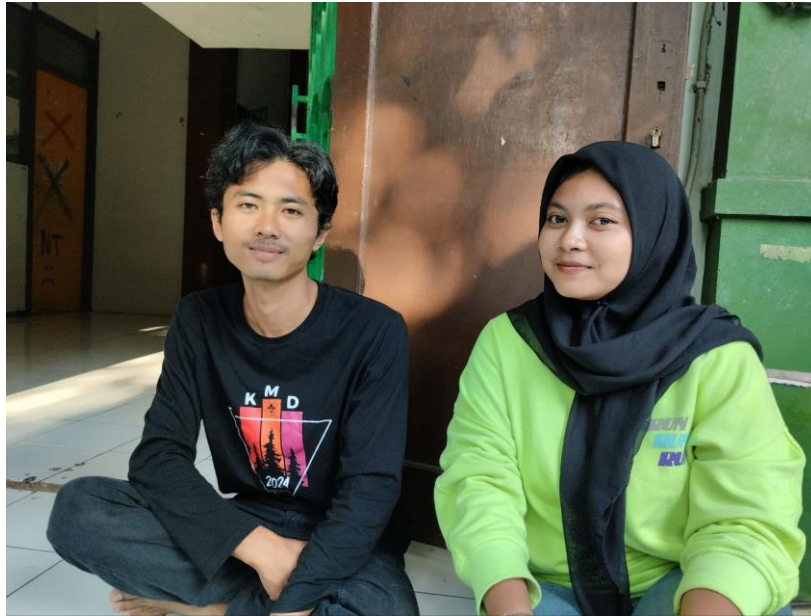
Lampiran 3. Wawancara dengan IF, jamaah Komunitas Gambang Syafaat