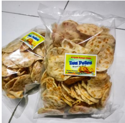
Dokumentasi Produk Pangan Kemasan Kripik Tempe Sagu “Dua Putera”