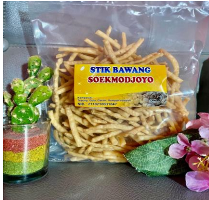
Dokumentasi Produk Pangan Kemasan Stik Bawang “Soekmodjoyo”