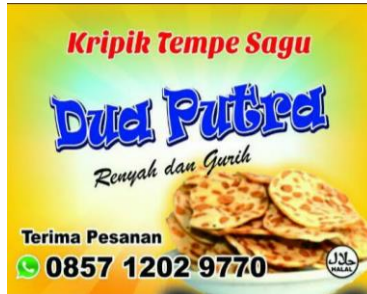
Gambar 3.1 Gambar label kemasan Kripik Tempe Sagu “Dua Putera”.

Bisa dilihat gambar kemasan diatas, pada label kemasannya mencantumkan tulisan yang berisi: