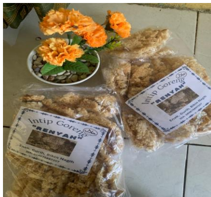
Dokumentasi Produk Pangan Kemasan Intip Goreng “Renyah”