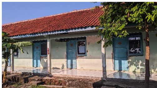
Gambar 19. Asrama Kapas untuk perempuan