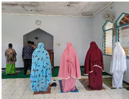
Gambar 3. 6 Pelaksanaan Shalat di Rumah Pelayanan Sosial Disabilitas Mental Muria Jaya Kudus

“Biasanya kalau di sini itu ada yang adzan dari temen-temen penerima manfaat, kemudian setelah adzan nanti kita membaca shalawat, biasanya yang dibaca itu shalawat tibbil qulub, sama nariyah biasanya tiga kali. Setelah itu shalat berjamaah, setelah shalat berjamaah ada dzikir, setelah dzikir biasanya ada kultum, setelah itu baru doa. Penerima manfaat yang ikut kegiatan biasanya itu teman-teman yang sudah siap untuk ikut kegiatan berjamaah dan teman-teman yang komunikasinya sudah bagus, dalam artian sudah komunikatif jiwanya stabil, tidak dalam keadaan kambuh, sehingga bisa diarahkan untuk shalat, yang penting PM mau dan stabil.”