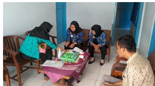
Gambar 16. Proses penerimaan penyandang disabilitas mental