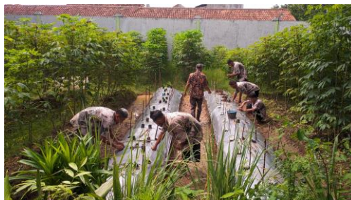
Gambar 3. 5 Pelaksanaan Bimbingan Pertanian di Rumah Pelayanan Sosial Disabilitas Mental Muria Jaya Kudus