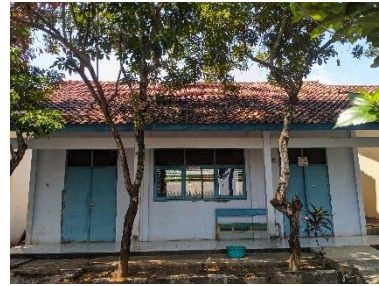
Gambar 28. Foto ruang keterampilan