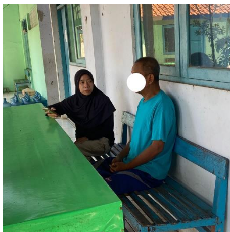
Gambar 3. Wawancara dengan subjek MS selaku penyandang disabilitas mental