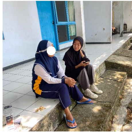
Gambar 2. Wawancara dengan subjek NJ selaku penyandang disabilitas mental