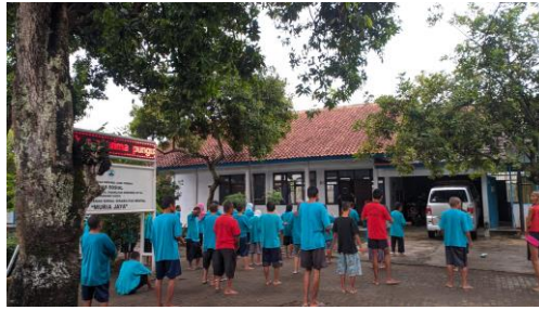
Gambar 3. 2 Pelaksanaan Bimbingan Olahraga di Rumah Pelayanan Sosial Disabilitas Mental Muria Jaya Kudus