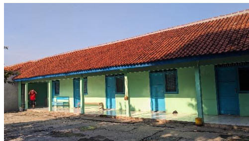
Gambar 20. Foto Asrama Luar