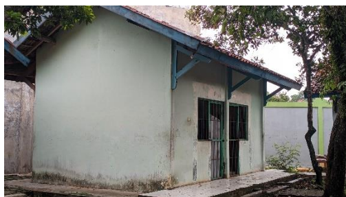
Gambar 21. Foto ruang observasi