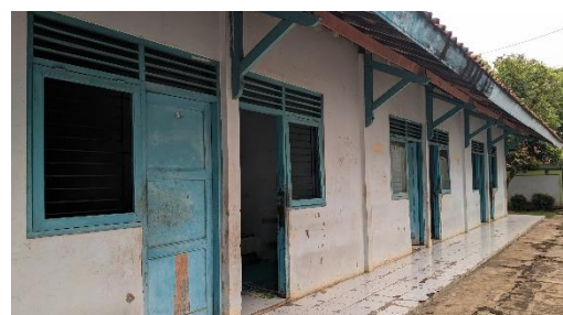
Gambar 18. Asrama Padi untuk Laki-laki