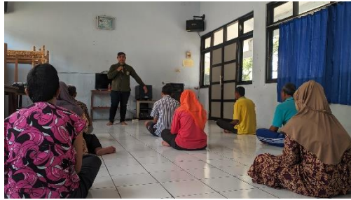
Gambar 11. Pemberian terapi oleh Pekerja Sosial