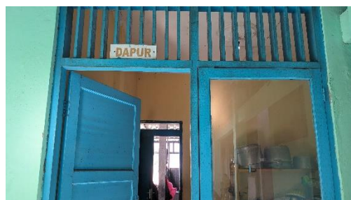
Gambar 24. Foto dapur