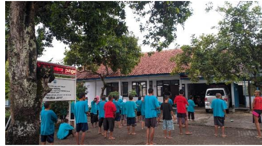
Gambar 12. Bimbingan Olahraga