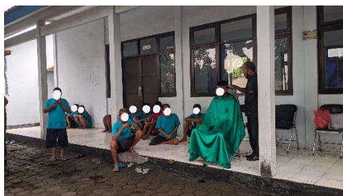
Gambar 13. Kegiatan Perawatan Diri penyandang disabilitas mental