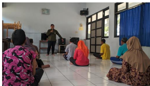
Gambar 3. 1 Pelaksanaan Bimbingan Psikososial di Rumah Pelayanan Sosial Disabilitas Mental Muria Jaya Kudus

“Di RPSDM Muria Jaya Kudus kita memberikan bimbingan, antara lain bimbingan fisik, ada senam, peregangan, kemudian bimbingan psikologis, nanti biasanya dengan psikolog atau terapi-terapi yang diberikan pekerja sosial, juga bimbingan sosial, itu bagaimana cara mereka bersosialisasi dengan masyarakat, biasanya lewat bimbingan budi pekerti, bimbingan ketertiban masyarakat, kemudian ada juga bimbingan keagamaan.”