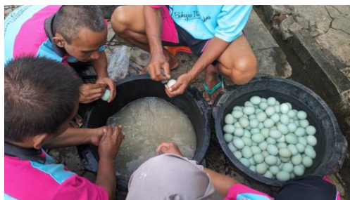
Gambar 3. 3 Pelaksanaan Bimbingan Stimulan Usaha Produktif Telur Asin di Rumah Pelayanan Sosial Disabilitas Mental Muria Jaya Kudus