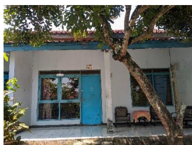
Gambar 25. Foto ruang konseling