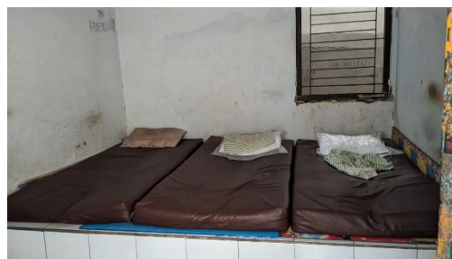
Gambar 22. Fasilitas di dalam kamar