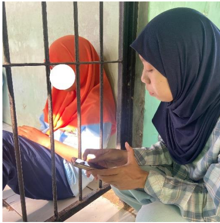
Gambar 1. Wawancara dengan subjek IL selaku penyandang disabilitas mental