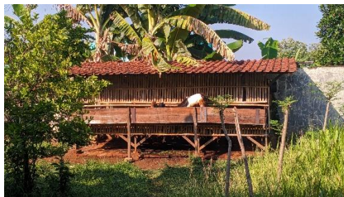
Gambar 31. Foto tempat peternakan