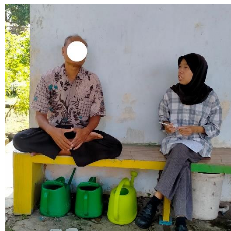
Gambar 4. Wawancara dengan subjek AC selaku penyandang disabilitas mental