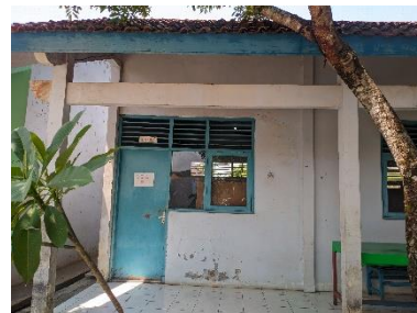
Gambar 30. Foto ruang penyimpanan pakaian