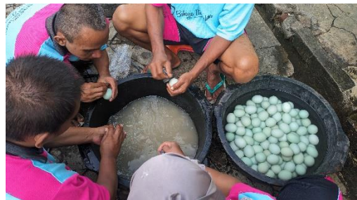
Gambar 10. Bimbingan Stimulan Usaha Produktif Home Industry Telur Asin