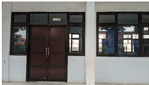
Gambar 29. Foto aula serbaguna