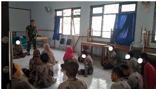
Gambar 7. Bimbingan Kesiapan dan Peran Serta Masyarakat