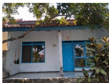
Gambar 26. Foto ruang pengaduan