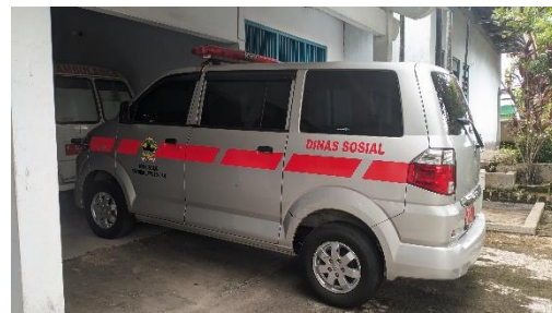
Gambar 32. Foto sarana transportasi