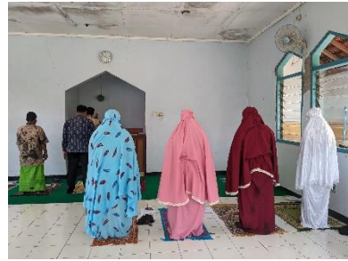
Gambar 6. Pelaksanaan kegiatan shalat bagi penyandang disabilitas mental