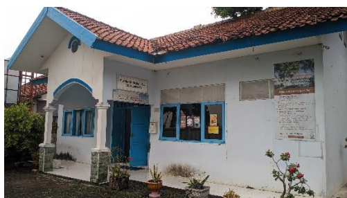
Gambar 17. Foto gedung kantor