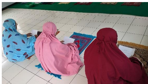
Gambar 3. 7 Membaca Shalawat ketika Proses Pelaksanaan Shalat

Pelaksanaan shalat yang diadakan oleh RPSDM Muria Jaya Kudus mempunyai tujuan tertentu. Adapun tujuan pelaksanaan shalat seperti yang dijelaskan oleh pekerja sosial RPSDM Muria Jaya Kudus melalui wawancara yang dilakukan penulis.