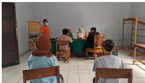
Gambar 15. Kunjungan dari Rumah Sakit Jiwa Surakarta