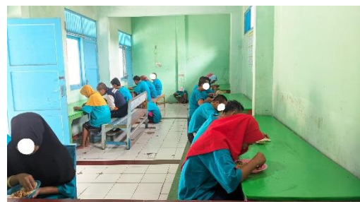
Gambar 14. Kegiatan makan bersama penyandang disabilitas mental