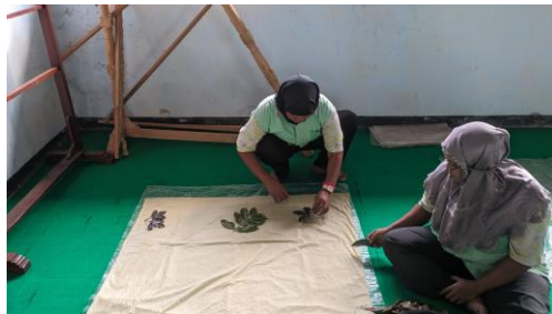
Gambar 3. 4 Pelaksanaan Bimbingan Stimulan Usaha Produktif Batik Eco Print di Rumah Pelayanan Sosial Disabilitas Mental Muria Jaya Kudus