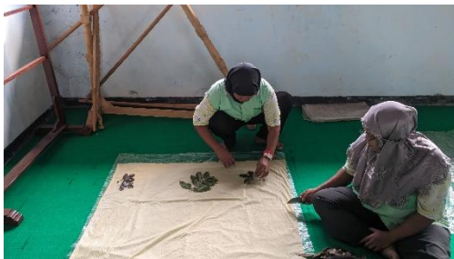
Gambar 9. Bimbingan Stimulan Usaha Produktif Batik Ecoprint