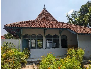
Gambar 27. Foto mushola