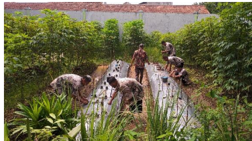
Gambar 8. Bimbingan Pertanian