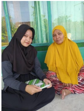
Wawancara Ibu Muasropah selaku petani masyarakat.