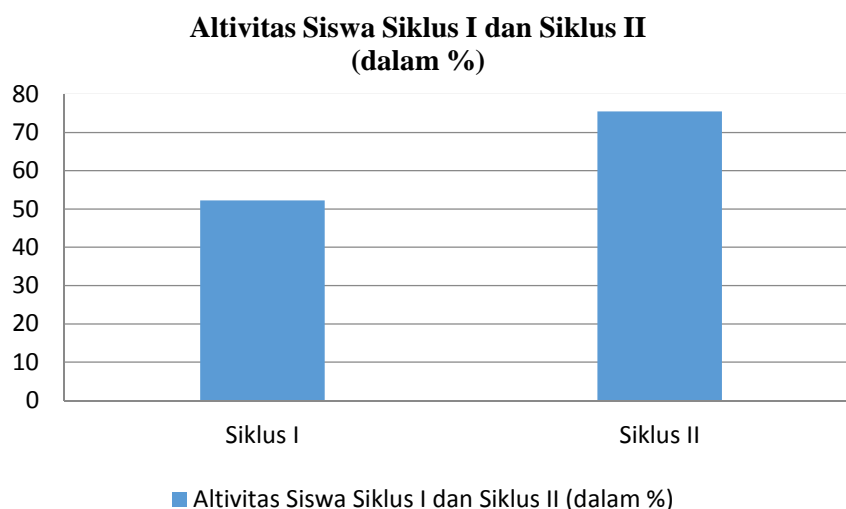
Grafik 4.1 Diagram Peningkatan Aktvitas Siswa

meningkat dalam setiap aspeknya. Sebagian besar siswa antusias dalam memperhatikan dan merespon penjelasan guru. Selanjutnya, siswa juga semakin aktif dalam kegiatan diskusi dan presentasi. Sikap siswa yang aktif dalam menjawab pertanyaan dari guru dan bertanya pada saat menemukan kesulitan mengalami peningkatan pada siklus II. Hasil observasi aktivitas siswa berdasarkan observasi, dan dokumentasi foto sebagai bukti meningkatnya keterampilan Menulis paragraf deskriptif pada siklus II.