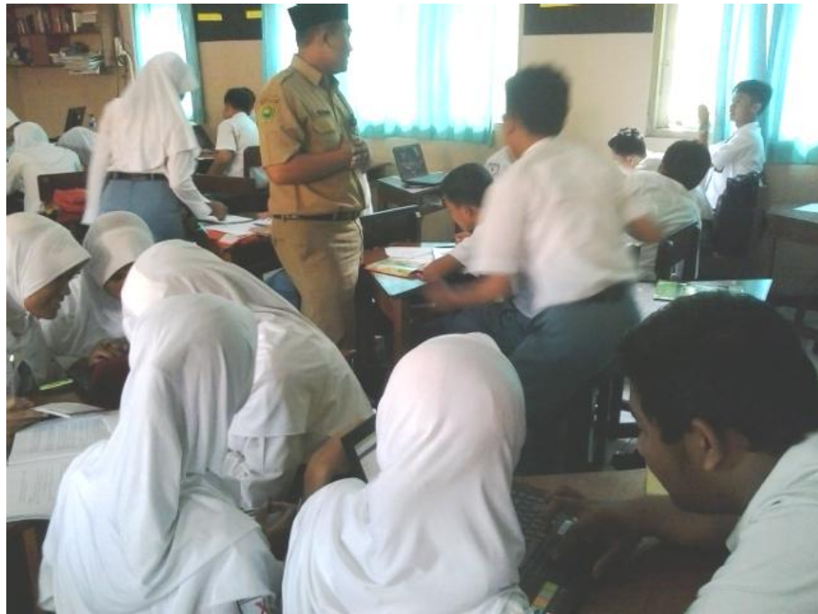
Proses kegiatan belajar mengajar