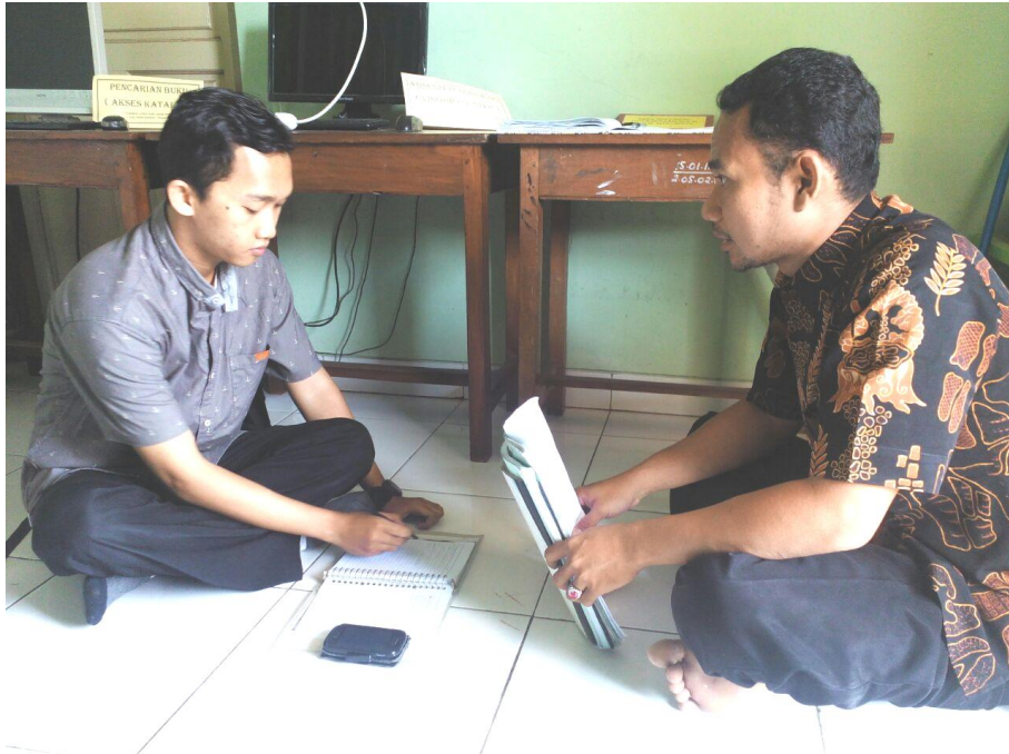
Wawancara dengan narasumber