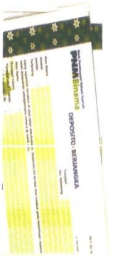
Daftar Nisbah Bagi Hasil Deposito Sebagai Berikut :