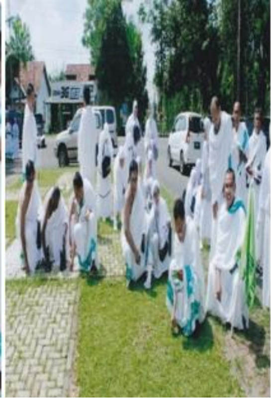
Proses Manasik KBIH Muslimat NU Kabupaten Tegal