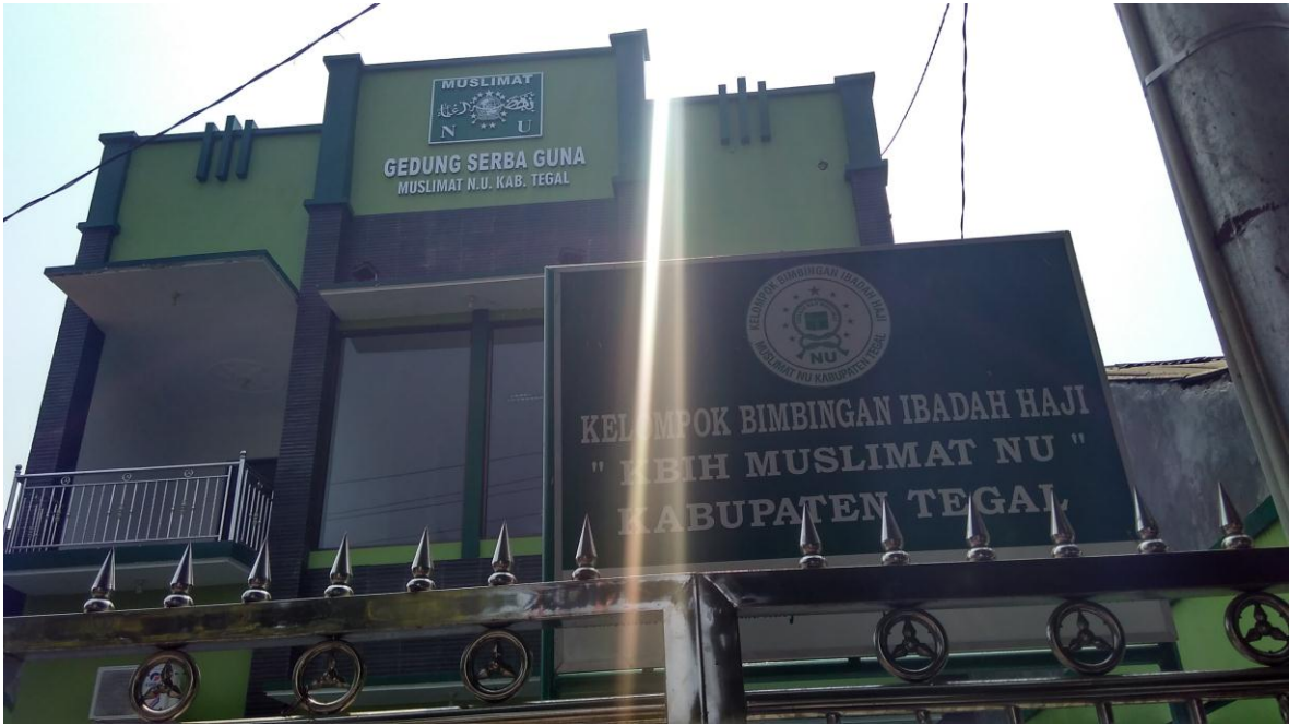
Kantor Kesekretariatan KBIH Muslimat NU Kabupaten Tegal