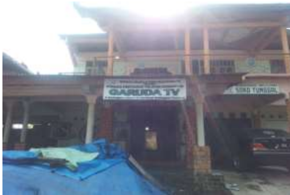
Gambar 7 STASIUN PENYIARAN TELEVISI GARUDA TV