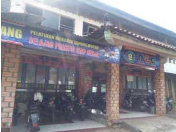
Gambar 5 PELATIHAN MEKANIK MOTOR YANG DIKEMBANGKAN OLEH PONDOK SOKO TUNGGAL