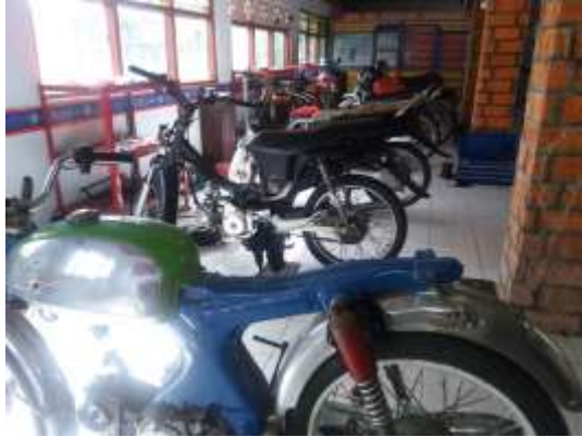
Gambar 6 MOTOR DAN PERALATAN LAINYA UNTUK PELATIHAN MEKANIK