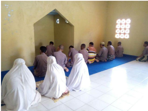
Gambar 8 Sholat Berjamaah