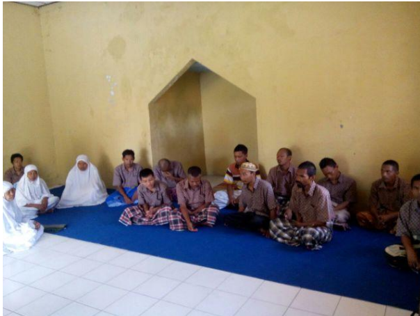
Gambar 6 Kultum Setelah Sholat Duhur