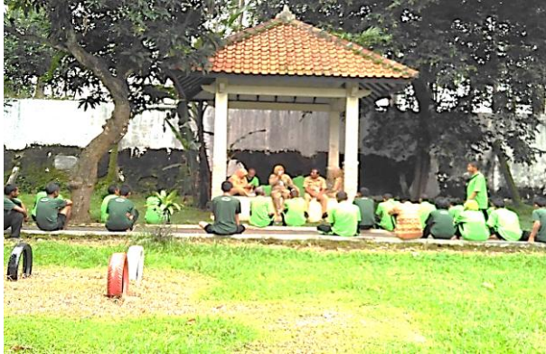
Gambar. 1. Bimbingan Kelompok