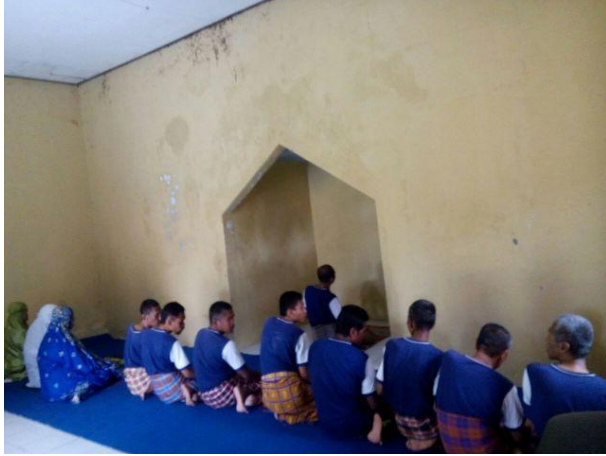
Gambar 7 Sholat Berjamaah