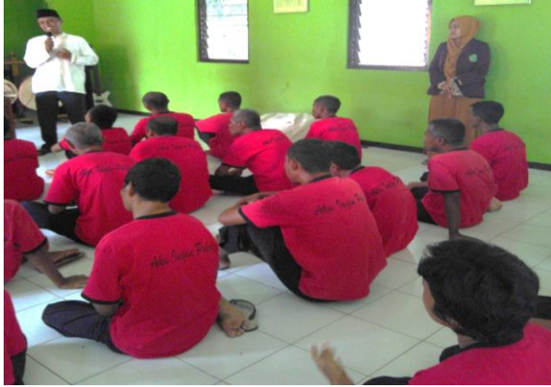
Gambar 5 Kegiatan bimbingan keagamaan