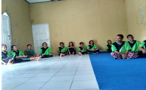
Gambar. 3. Kegiatan berdiskusi