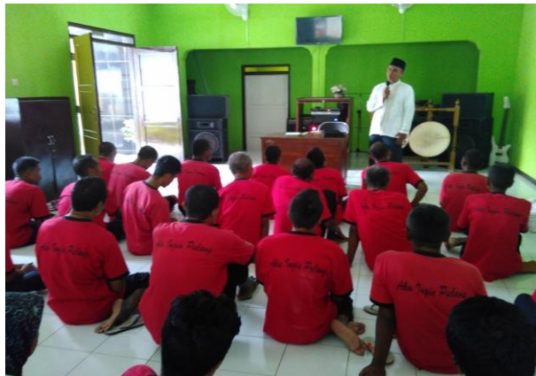
Gambar 4 Kegiatan saat bimbingan kegiatan berlangsung