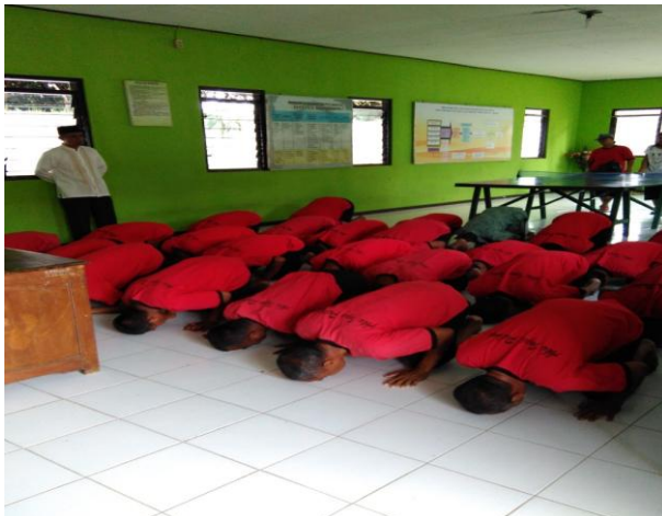
Gambar. 2. Praktek Shalat Berjama'ah