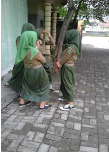
Gambar 3. Fenomena narsisme