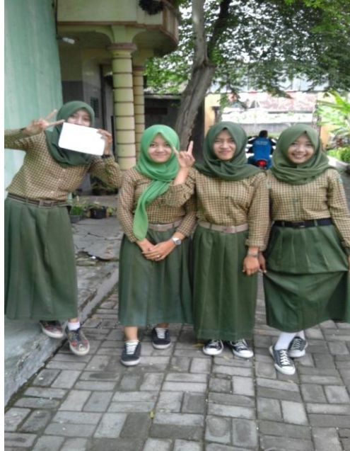
Gambar 5. Fenomena narsisme