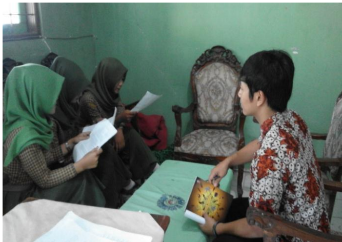
Gambar 6. Wawancara dengan sebagian siswi yang berperilaku narsisme