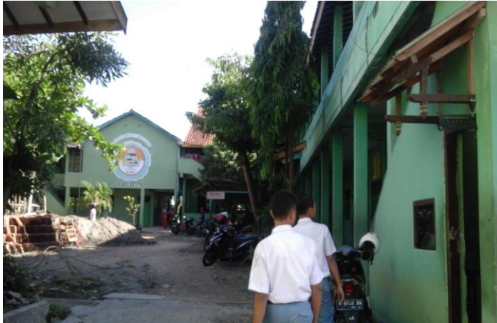
Gambar 1. Sekolah SMK Ma'arif Tunjungan Blora