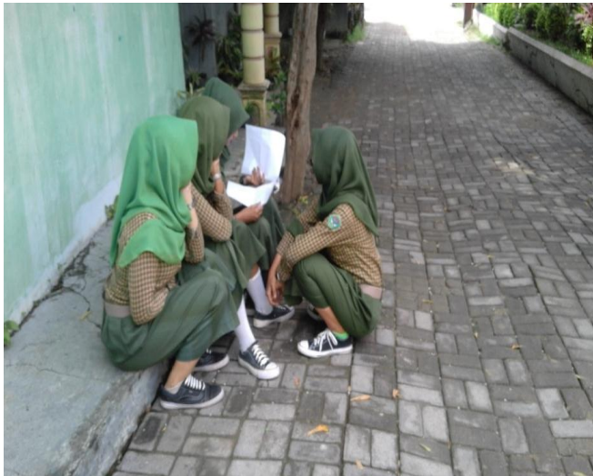
Gambar 4. Fenomena narsisme