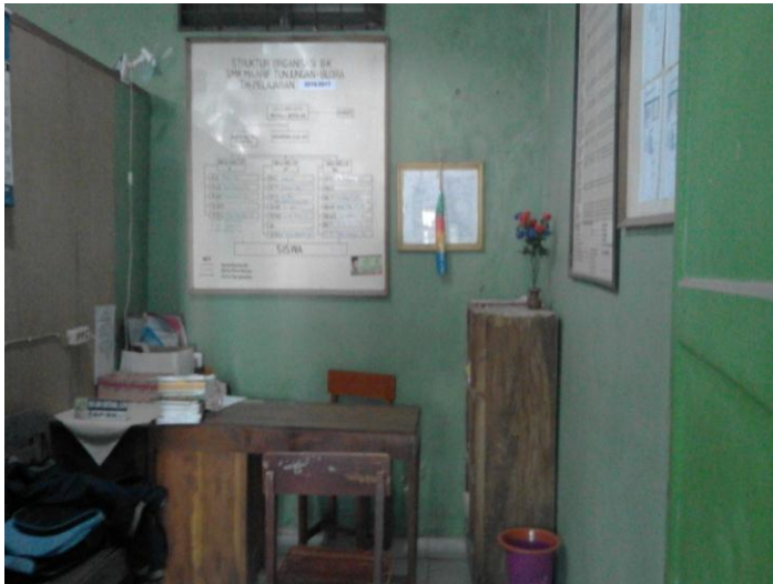
Gambar 2. Ruang BK