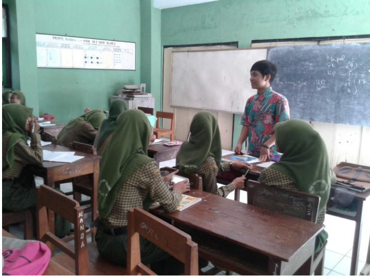
Gambar 7. Pemberian layanan BKI terhadap siswi yang berperilaku narsisme