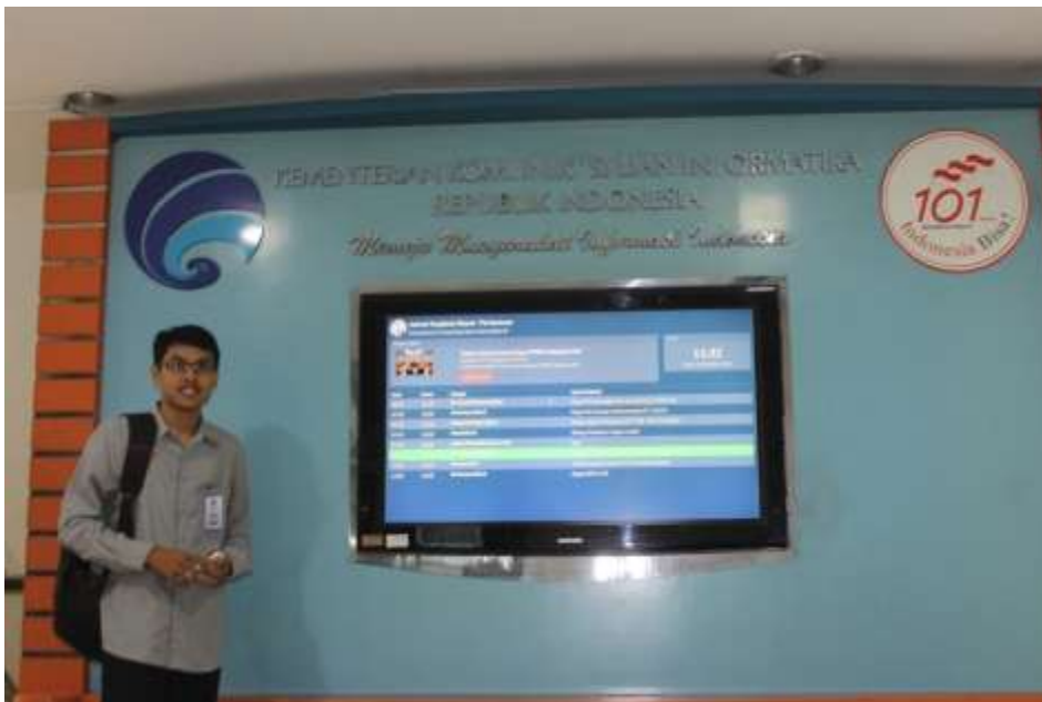
Peneliti foto di gedung Kemenkominfo