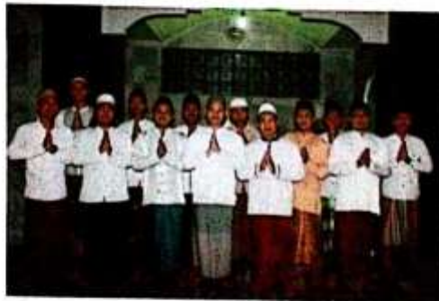
Pengurus Pondok Pesantren Futuhiyyah Mranggen Demak