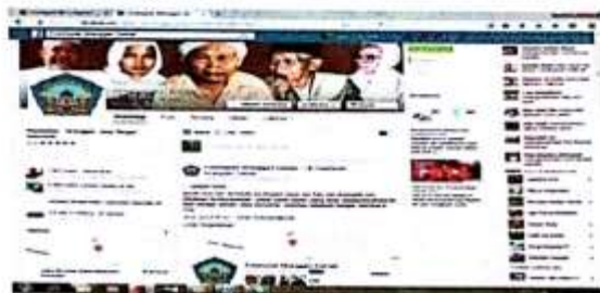
Alamat Facebook Pondok Pesantren Futuhiyyah Mranggen Demak