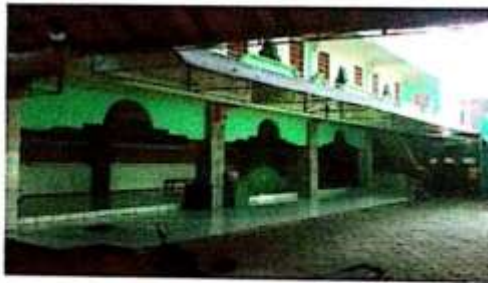
Masjid Pondok Pesantren Futuhiyyah Mranggen Demak