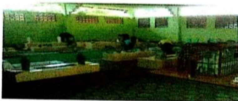
Ro'an maqom Masyayikh Futuhiyyah setiap hari Jum'at usai ziaroh kubur