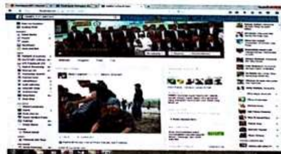
Alamat facebook organisasi pondok Assosiasi Santri Futuhiyyah (ASSIFA)