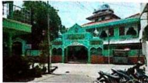
Pondok Pesantren Futuhiyyah Mranggen Demak tampak dari luar