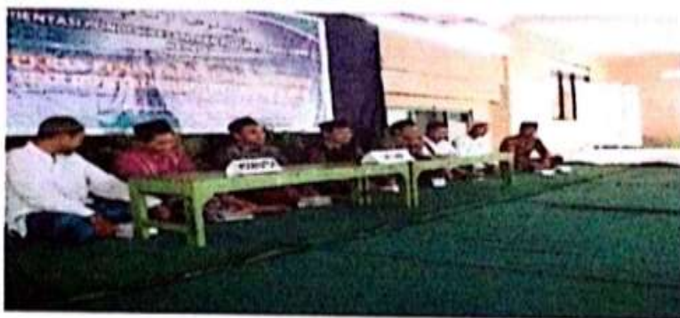
Orientasi Pengenalan Pondok (OOP) di aula Yayasan Pondok