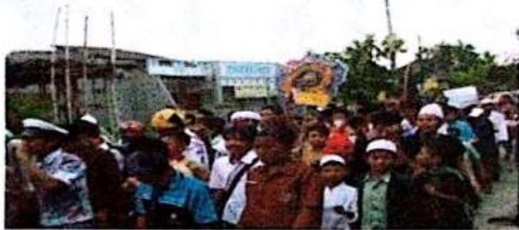
Pawai dalam rangka Muwadda'ah wa Khotmil Kutub & Qur'an