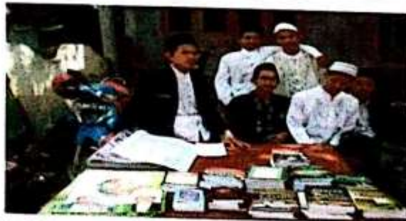
Bazar buku dalam rangka Haul Simbah KH. Abdurrahman bin Qoshidil Haq