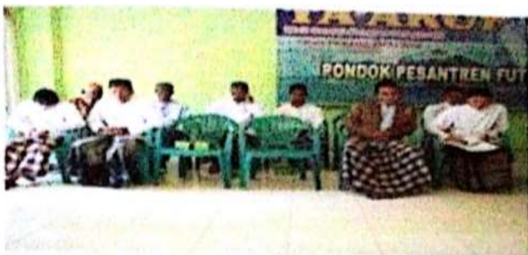
Ta'aruf wali santri dengan Pengasuh di aula Yayasan Pondok