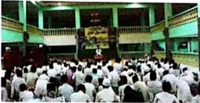
Peringatan Nuzulul Qur'an Pondok Pesantren Futuhiyyah Mranggen Demak