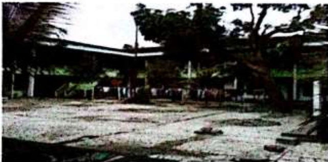
Deretan kamar santri Pondok Pesantren Futuhiyyah Mranggen Demak