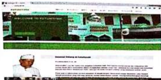
Alamat web Pondok Pesantren Futuhiyyah Mranggen Demak