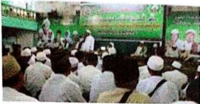
Pelaksanaan Thoriqoh Qodiriyyah wa Naqsyabandiyyah di Pondok Pesantren Futuhiyyah Mranggen Demak