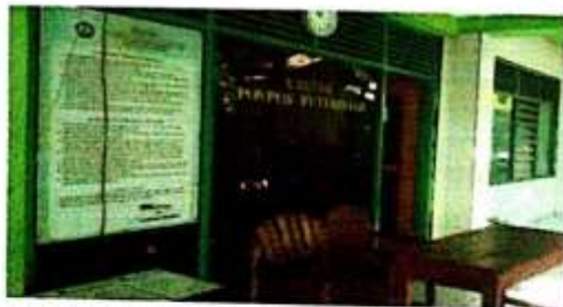
Kantor Pondok Pesantren Futuhiyyah Mranggen Demak