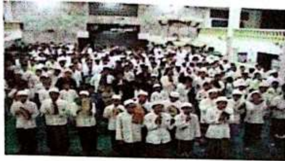
Maulid Dzibaiyyah setiap malam Jum'at di Masjid Pondok Pesantren Futuhiyyah Mranggen Demak