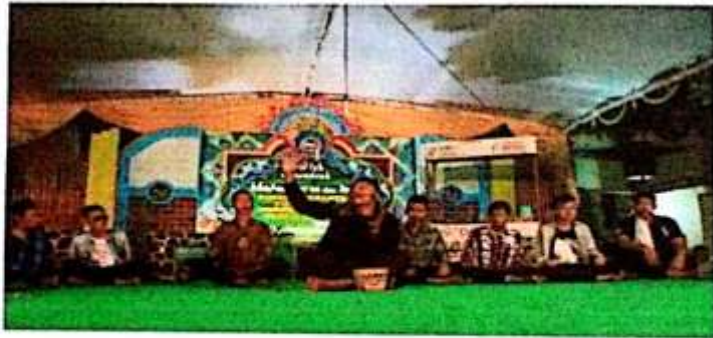
Pementasan teater saat Hafiah Akhirus Sanah Pondok Pesantren Futuhiyyah Mranggen Demak