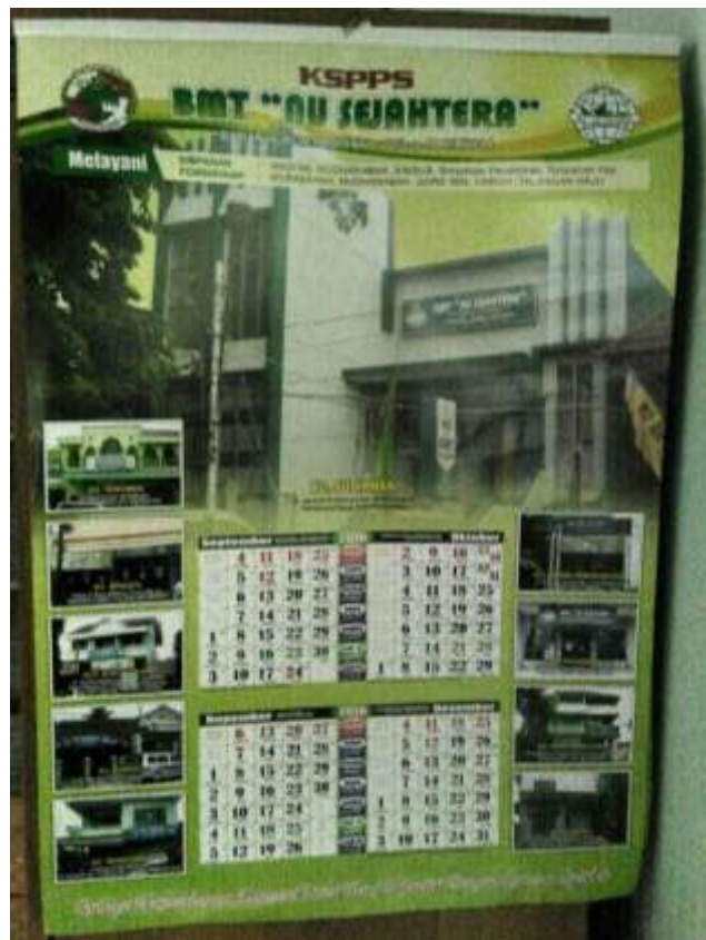
Gambar 3.6 Kalender BMT NU Sejahtera

BMT NU Sejahtera membagi-bagikan kalender, kaos dan mug gratis setiap tahunnya kepada para anggotanya. Media-media ini dibagikan kepada para anggota dengan tujuan masyarakat dapat melihat dan mengetahui secara tidak langsung tentang BMT NU Sejahtera melalui media-media yang dipakai atau dimiliki oleh para anggota. Kalender BMT menggunakan gambar-gambar hewan, bunga dan kantor BMT, begitu juga dengan kaos dan mug hanya berisi tulisan saja. Biasanya kalender, kaos, dan mug diberikan dengan cuma-cuma kepada anggotanya seperti kalender diberikan kepada anggotanya pada waktu akhir tahun, mug diberikan kepada anggotanya pada waktu mendekati hari raya Idul Fitri dan kaos diberikan kepada anggotanya pada waktu ada event-event tertentu seperti kegiatan jalan santai.