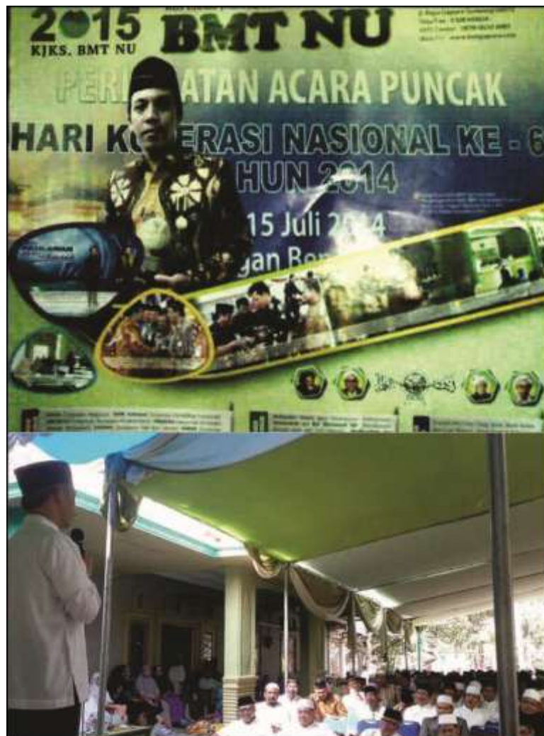
Gambar 3.11 Promosi BMT NU Sekahtera melalui acara Pengajian dalam rangka memperingati Hari Koperasi Nasional

taklim, jama'ah shalawat yang mayoritas menganut faham NU. BMT NU Sejahtera dalam hal ini sangat diuntungkan karena seringkali diperkenalkan oleh para pemuka / tokoh agama tanpa disuruh sekalipun. Bauran promosi inilah yang dianggap penulis lebih efektif dibandingkan bauran promosi yang lain karena selain murah (tanpa mengeluarkan biaya), publisitas inilah yang paling banyak membuat masyarakat lebih mengenal BMT NU Sejahtera yang pada akhirnya menjadi anggota.