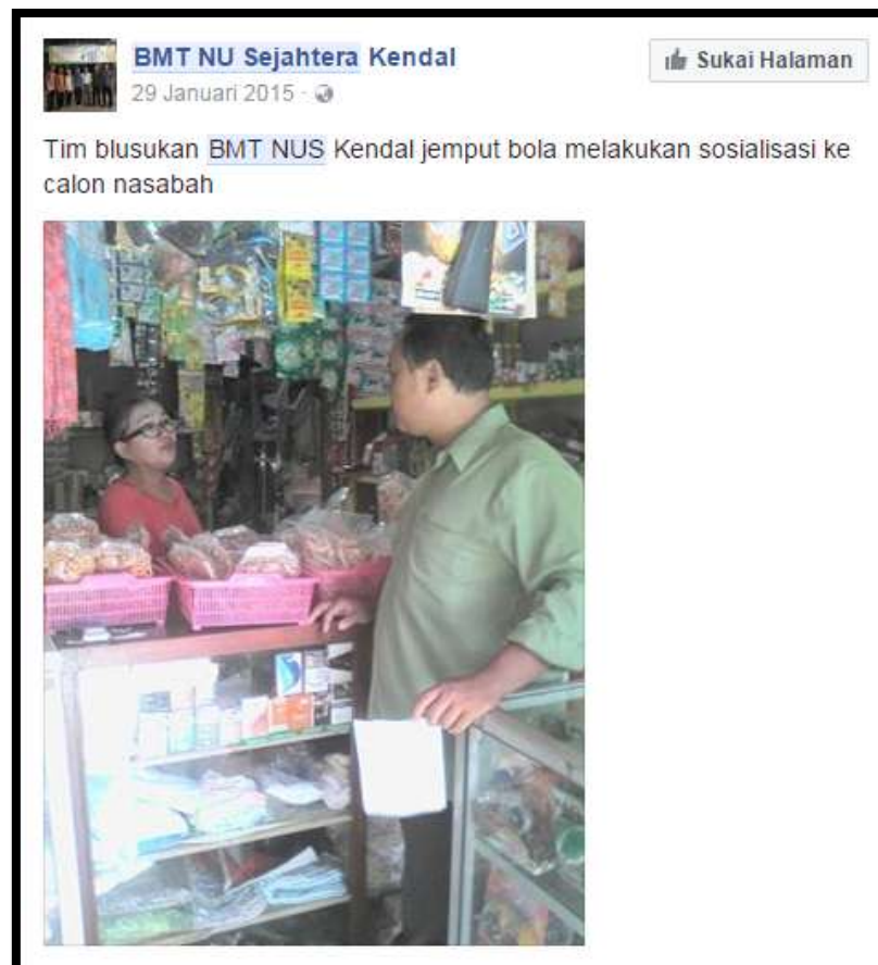
Gambar 3.8 Promosi BMT NU Sejahtera melalui media facebook