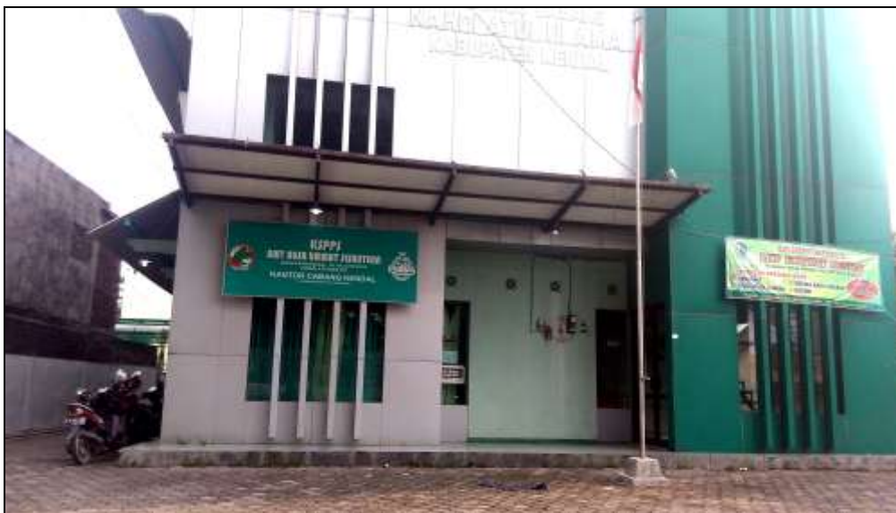
Gambar 3.1 Gedung BMT NU Sejahtera Kendal

pemikiran kalangan nahdhiyyin (NU) terkait masalah pengembangan ekonomi umat Islam. Hal ini disebabkan banyaknya di kalangan umat Islam yang masih membutuhkan bantuan pengembangan usaha, khususnya yang masih dalam tingkat usaha kecil dan mikro. 99