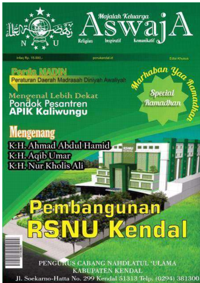
Gambar 3.4 Majalah Aswaja

BMT NU Sejatera mengiklankan produk-produknya melalui majalah-majalah berbasis NU, seperti majalah aswaja NU PC Kabupaten Kendal yang diluncurkan oleh NU Kabupaten Kendal yang berisikan tentang rubric NU dan umum termasuk memperkenalkan BMT NU Sejahtera Kendal di masyarakat luas. cara mendapatkannya dengan membeli di gedung NU Kabupaten Kendal yang dikelola oleh PC Kabupaten Kendal tetapi tidak setiap majalah ada promosi dari BMT.