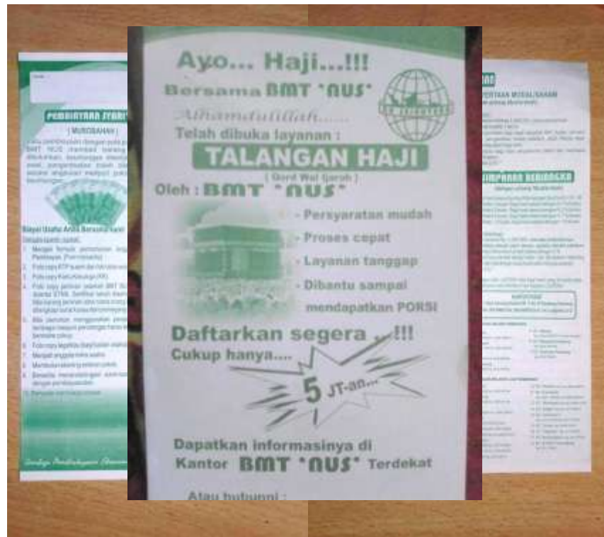
Gambar 3.5 Brosur-brosur BMT NU Sejahtera

BMT NU Sejahtera mengiklankan produk-produknya melalui media brosur yang di dalamnya berisikan tentang produk-produk BMT dan dibagikan kepada masyarakat ketika ada event-event / acara tertentu seperti ketika ada Car Free Day , Kendal Expo dan juga dibagikan kepada anggota yang datang di kantor BMT NU Sejahtera. Brosur BMT sangat sederhana hanya ada tulisan-tulisan tentang produk-produk BMT serta gambar kantor BMT NU Sejahtera Kendal. Brosur ini bertujuan agar masyarakat yang membaca brosur tersebut mengetahui adanya system bagi hasil yang ada di BMT serta untuk bahan pertimbangan masyarakat dengan produk-produk Bank lain karena brosur berisi produk-produk BMT.