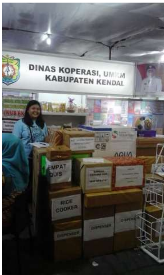
Gambar 3.10 Promosi BMT NU Sekahtera melalui acara Kendal Expo

dilakukan di kota kendal seperti Car Free Day dan Kendal Expo dengan membuat stand-stand untuk lebih memperkenalkan dan mempromosikan profil serta produk-produknya kepada masyarakat luas dengan ide-ide kreatif karyawan-karyawannya, mereka juga turut serta hadir untuk membagikan brosur serta menjelaskan berbagai produk dan promosi mereka. Terkadang membuat MMT di tempat tersebut yang bekerja sama dengan IPNU-IPPNU PAC Kendal, salah satu organisasi pelajar di Kota Kendal.