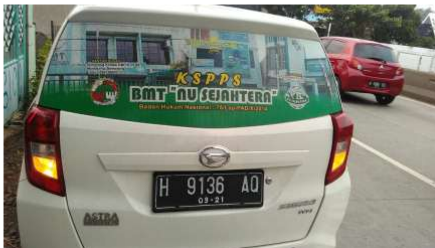
Gambar 3.7 Iklan transit BMT NU Sejahtera di mobil inventaris

BMT NU Sejahtera menggunakan mobil inventaris untuk ditempel iklan sederhana yang hanya menampilkan logo, gambar gedung, dan alamat. Cara ini dilakukan agar lebih banyak orang/masyarakat dapat mengetahui keberadaan BMT NU Sejahtera meskipun hanya sebatas mengenal secara sekilas.