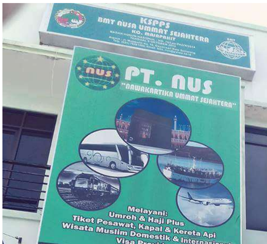
Gambar 3.9 Media Spanduk BMT NU Sejahtera

BMT NU Sejahtera sering menjadi sponsor kegiatan-kegiatan NU terutama PAC. IPNU-IPPNU Kecamatan Kendal. Sehingga media-media ini juga secara tidak langsung akan dilihat oleh peserta kegiatan yang berasal dari berbagai kalangan, tetapi tulisan atau logo BMT yang ada di MMT sebagai sponsor pada kegiatan-kegiatan NU kecil dan dibawah.