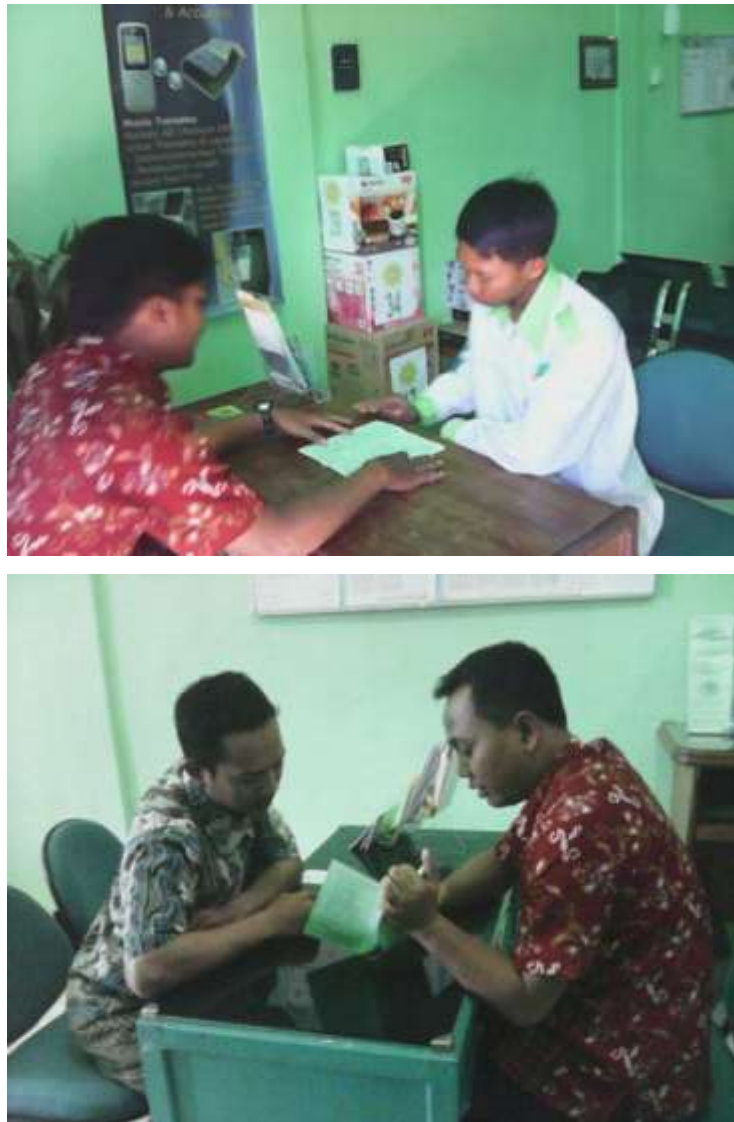
Gambar 3.3 Karyawan BMT NU Sejahtera melakukan personal selling di sekolah-sekolah dan kantor-kantor

bersilaturohim berkunjung di rumahnya supaya mereka mau menjadi anggota BMT.