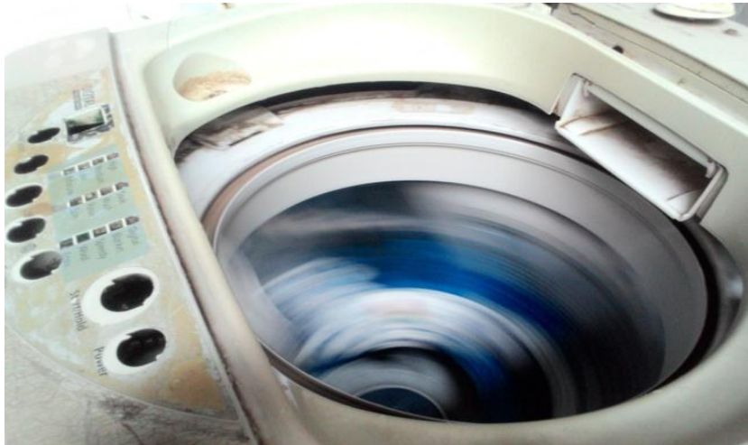
Pengeringan dengan dinamo