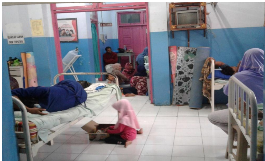
Suasana Ruang Rawat Inap pasien BPJS Kesehatan Di Puskesmas Larangan.