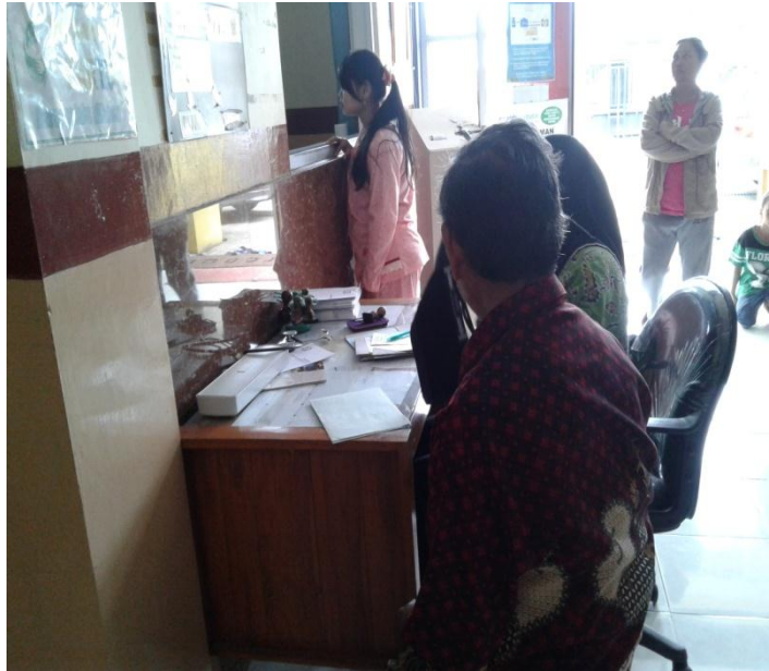
Suasana loket pendaftaran Puskesmas Larangan.