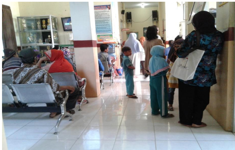
Suasana ruang tunggu Puskesmas Larangan.