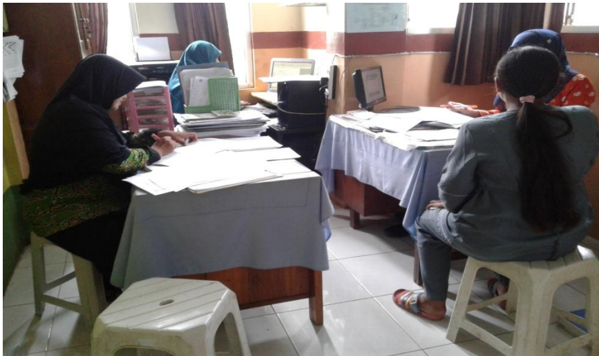
Suasana Pemeriksaan di ruang KIA.