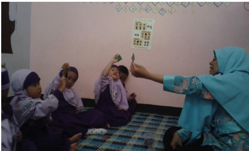
Pembelajaran Dengan Kartu warna