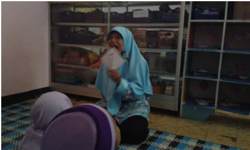
Pembelajaran Tanpa Kartu Warna