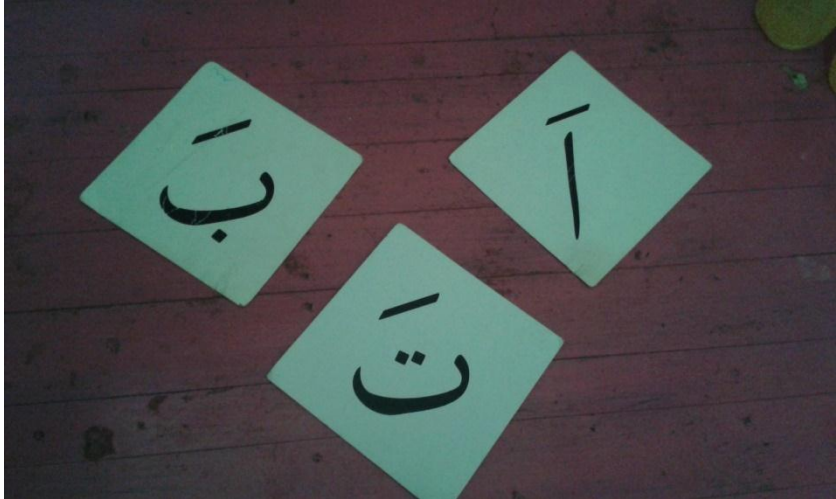
Contoh Kartu Tanpa warna