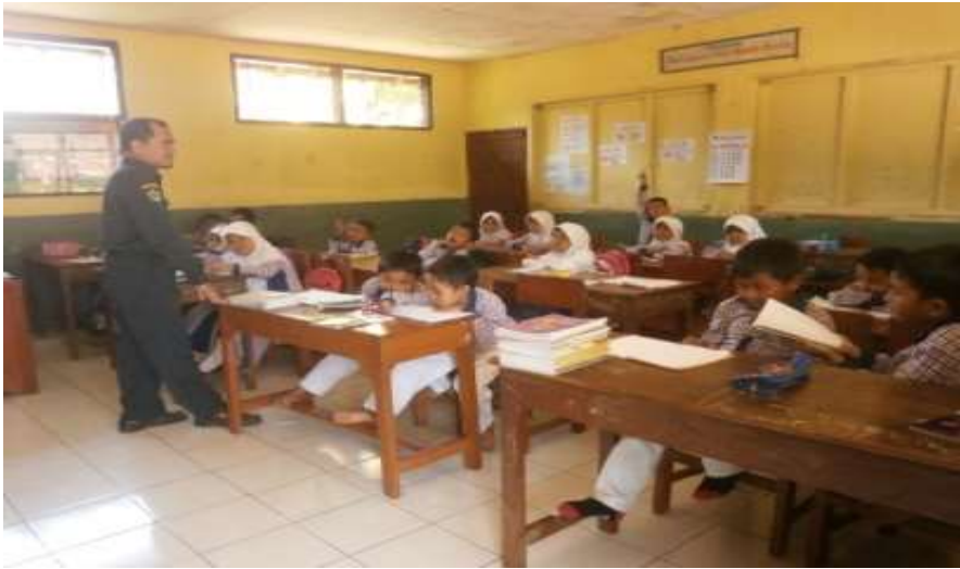
Gambar 3: Proses belajar mengajar dengan ruangan yang nyaman dan memadai