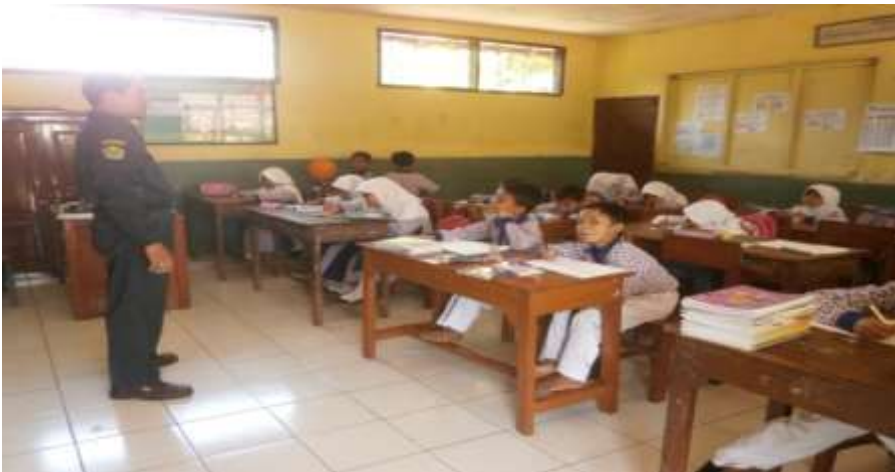
Gambar 2: proses belajar mengajar dengan ruang kelas yang nyaman dan memadai

Rincian dana BOS yang diterima oleh madrasah untuk kegiatan 8 Standar Nasional Pendidikan, yang menjadi bukti untuk laporan ke kementerian agama kabupaten