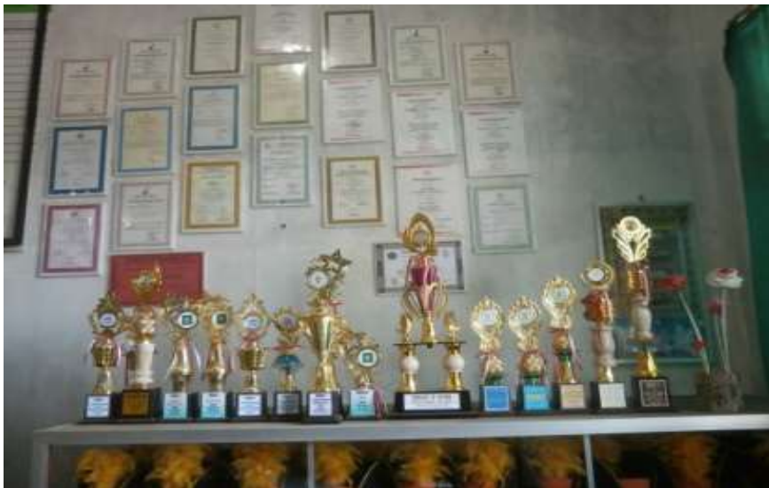
Gambar 4: Hasil prestasi peserta didik