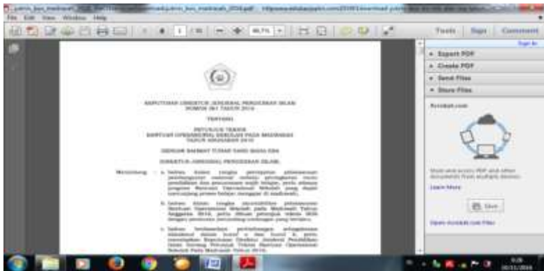
Gambar 2: Aturan petunjuk teknis dana BOS pada madrasah sebagai acuan penggunaan dana BOS