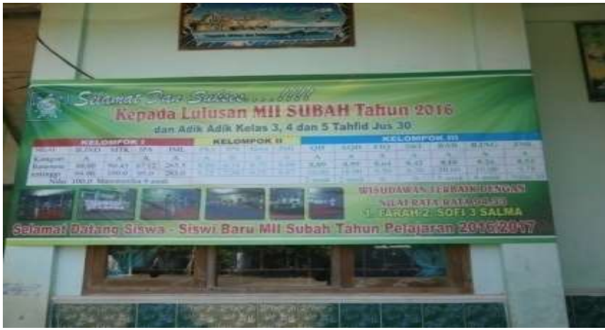
Gambar 5 : Hasil prestasi akademik pada saat Ujian Nasional mendapat peringkat 2 sekabupaten