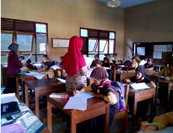
Foto kegiatan tes membaca al-Qur'an