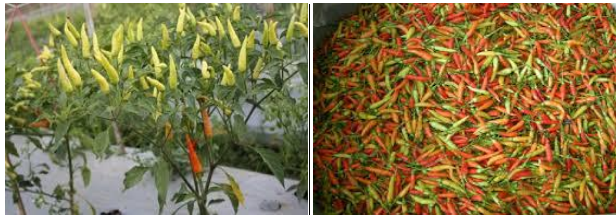
Gambar 2.8 Cabai Bhaskara 16

Cabai Bhaskara memiliki panjang 5,2-6,9 cm, diameter 0,6-0,8 cm, warna buah muda hijau terang, warna buah tua merah cerah, bentuk buah silindris, bentuk ujung buah lancip, rasa buah pedas (Gambar 2.8).