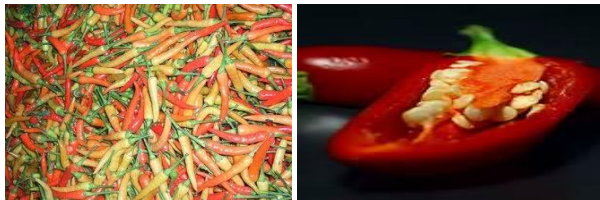
Gambar 2.3 Buah dan Biji Cabai 7

Tanaman cabai memiliki bentuk buah yang bervariasi sesuai dengan varietasnya. Ada buah yang berbentuk bulat sampai bulat panjang dengan bagian ujung meruncing, mempunyai 2-3 ruang yang berbiji banyak. Buah yang masih muda umumnya berwarna hijau, putih kekuningan, dan ungu bergantung pada varietasnya (Gambar 2.3).