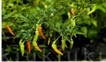
Gambar 2.4 Tanaman Cabai Rawit 11

Genus : Capsicum Spesies : Capsicum frutescens L. Varietas : Bhaskara 10 Nama daerah : Cabai Setan