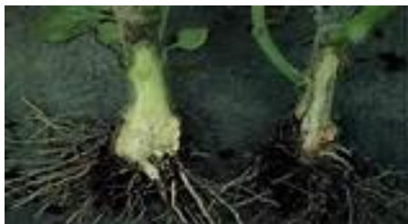
Gambar 2.1 Akar cabai 1

Akar tumbuhan merupakan struktur tumbuhan yang terdapat dalam tanah. Akar sebagai tempat masuknya mineral (zat-zat hara) dari tanah menuju ke seluruh bagian tumbuhan. (Gambar 2.1).