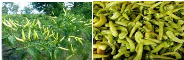
Gambar 2.7 Cabai Rawit Putih 15

Cabai putih memiliki ciri – ciri buah berbentuk bulat agak lonjong dan berukuran panjang 3 cm serta berat rata – rata 2,5 g/buah. Buah yang muda memiliki rasa yang kurang pedas, namun buah yang matang memiliki rasa pedas (Gambar 2.7).