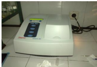
Gambar 2.9 Spektrofotometer UV-Vis 46

Absorban yang terbaca pada spektrofotometer hendaknya antara 0,2 sampai 0,8 atau 15% sampai 70% jika dibaca sebagai transmitans. Anjuran ini berdasarkan anggapan bahwa kesalahan dalam pembacaan T adalah 0,005 atau 0,5% (kesalahan fotometrik). 45 Spektrofotometer UV-Vis (gambar 2.9).