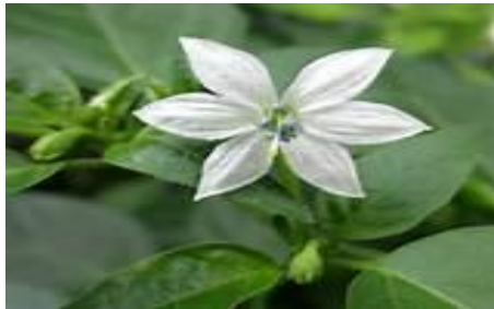
Gambar 2.2 Bunga Cabai 5

Mahkota bunga tanaman cabai warnanya bermacam-macam, ada yang putih, putih kehijauan, dan ungu. Diameter bunga antara 5-20 mm. Bunga tanaman cabai merupakan bunga sempurna, artinya dalam satu tanaman terdapat bunga jantan dan bunga betina (Gambar 2.2).