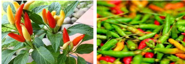
Gambar 2.6 Cabai Rawit Ceplik 14

Cabai ceplik atau cabai hijau memiliki panjang 3 – 3,5 cm dan lebar 11 mm, serta berat 1,4 g/buah. Pada waktu masih muda, buah berwarna hijau dan berubah menjadi merah pada saat matang. Rasa buah pedas, tetapi masih kurang pedas jika dibandingkan dengan cabai kecil dan cabai putih (Gambar 2.6).