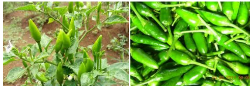
Gambar 2.5 Cabai Rawit Kecil 13

Jenis cabai kecil sering disebut sebagai cabai jemprit . Cabai jenis ini memiliki karakteristik ukuran buah kecil, panjang 2 - 2,5 cm dan lebar 5 mm, serta berat 0,65 g/buah. Pada saat masih muda, buah berwarna hijau dan pada saat masak berubah menjadi merah (Gambar 2.5).