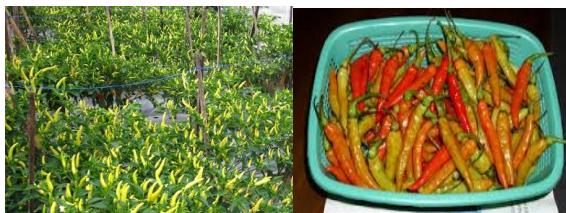
Gambar: 4.1 Tanaman dan Buah Cabai Rawit Varietas Bhaskara 2

tinggi dengan altitude 150-1.050 mdpl. Cabai rawit varietas Bhaskara ditunjukkan pada Gambar 4.1. 1