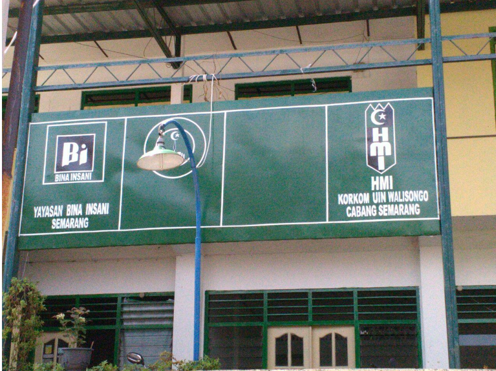
1. KANTOR HMI KORKOM UIN WALISONGO SEMARANG