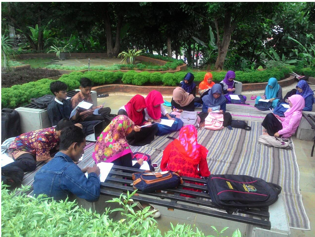
6. KAJIAN BAHASA OLEH LBMI