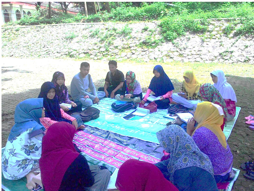
8. DISKUSI KOHATI (HMI-WATI), TERKAIT PEREMPUAN DALAM ISLAM