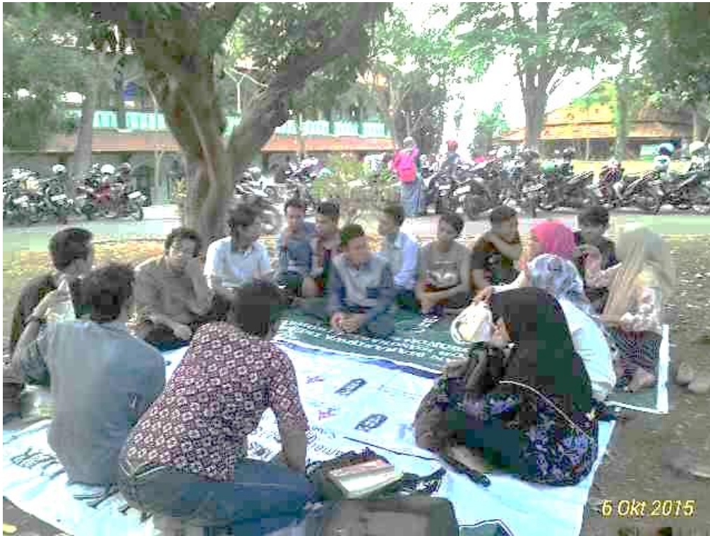
9. DISKUSI MINGGUAN DI KAMPUS