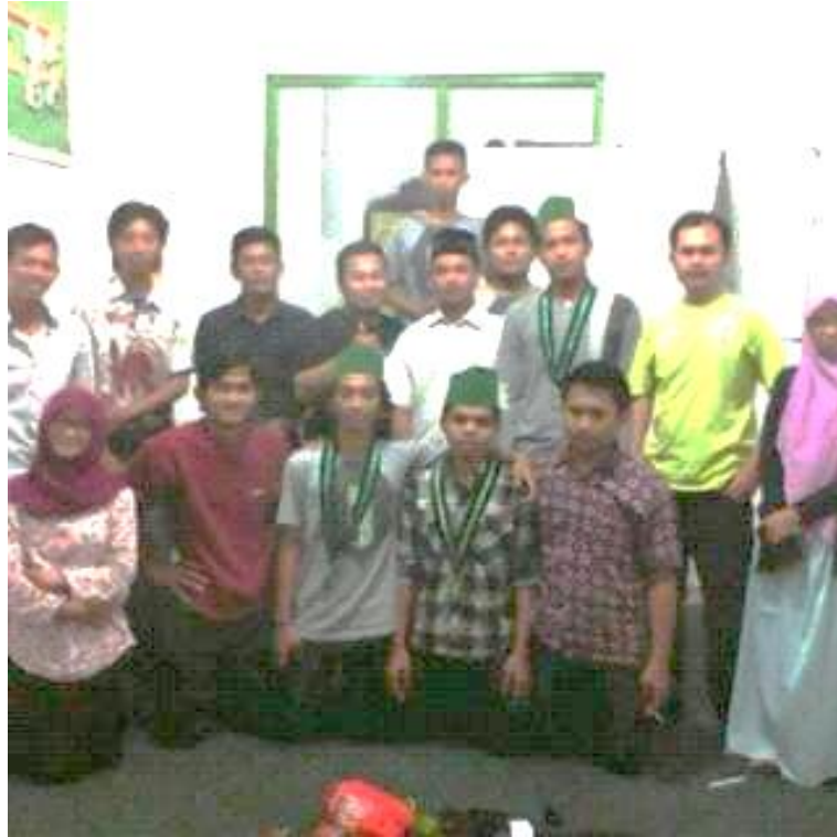
5. FORUM DISKUSI CDIS (CENTRAL OF DEMOCRACY AND ISLAMIC STUDIES)