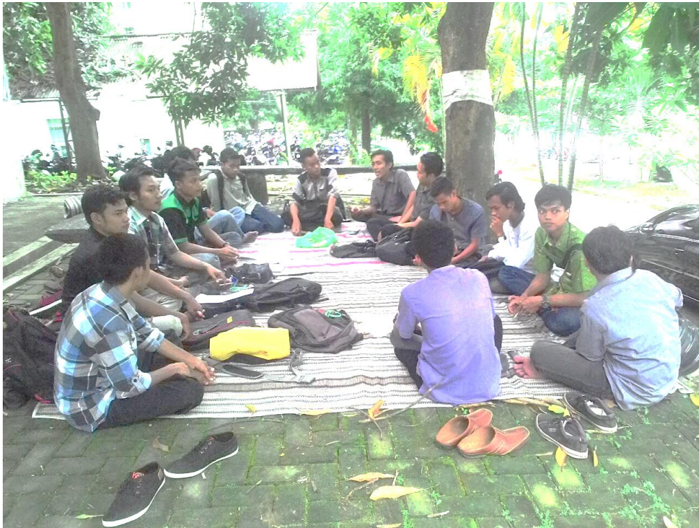
7. PENDAHULUAN MATERI “ISLAM SEBAGAI ASAS HMI” HMI KOM IQBAL FUHUM