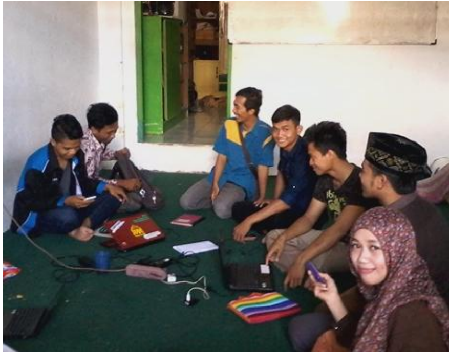
13. WAWANCARA DENGAN KETUA DAN PENGURUS KORKOM UIN WALISONGO SEMARANG DI SEKRETARIAT HMI