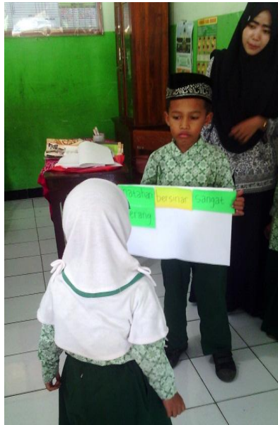
GAMBAR 11. MASING-MASING KELOMPOK MAJU MEMBACAKAN HASIL DISKUSINYA

HASIL AKHIR EVALUASI BERSAMA GURU KELAS 1 MI NU AL MA'ARIF BLIMBING REJO JEPARA