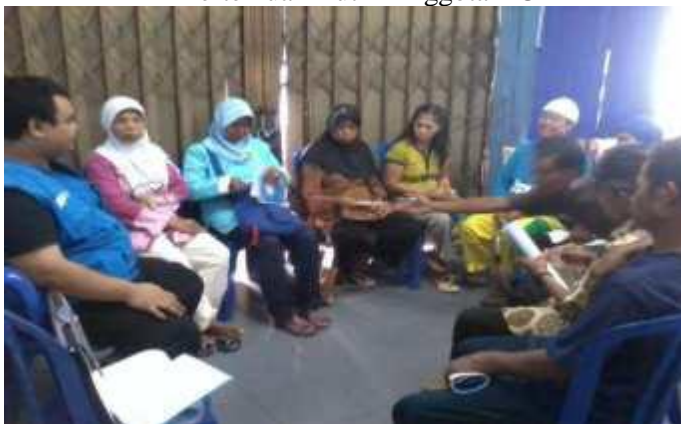
Gambar 3.1 Pertemuan Rutin Anggota KUMM