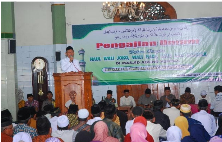
Pengajian Umum Haul