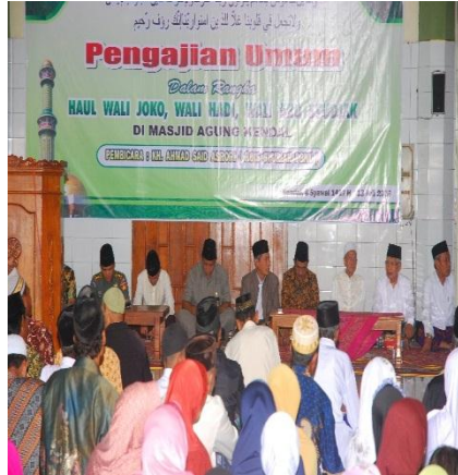
Pengajian Umum Haul