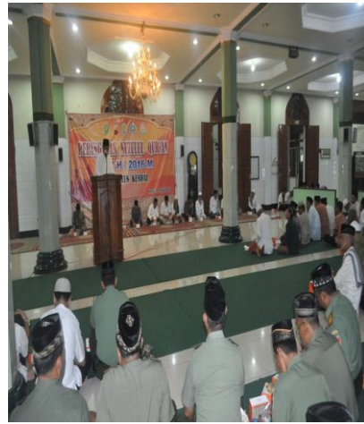
Peringatan Nuzulul Quran