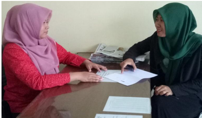
Foto wawancara dengan bagian pembukuan KSPPS BMT Walisongo