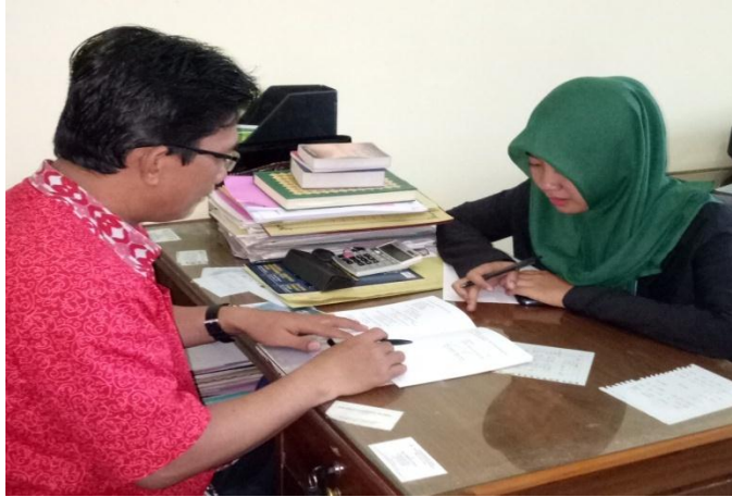
Foto wawancara dengan teller KSPPS BMT Walisongo