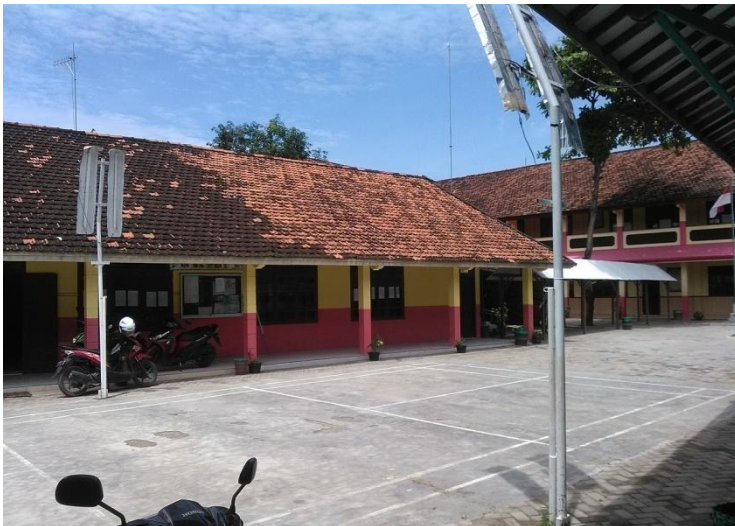
Lapangan Olahraga MTs. Miftahul Huda Maguan Kaliori Rembang