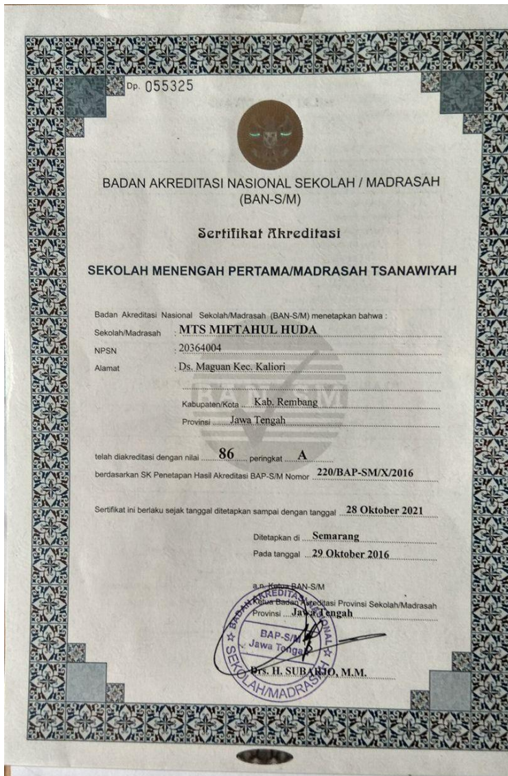
Sertifikat Akreditasi MTs. Miftahul Huda Maguan Kaliori Rembang