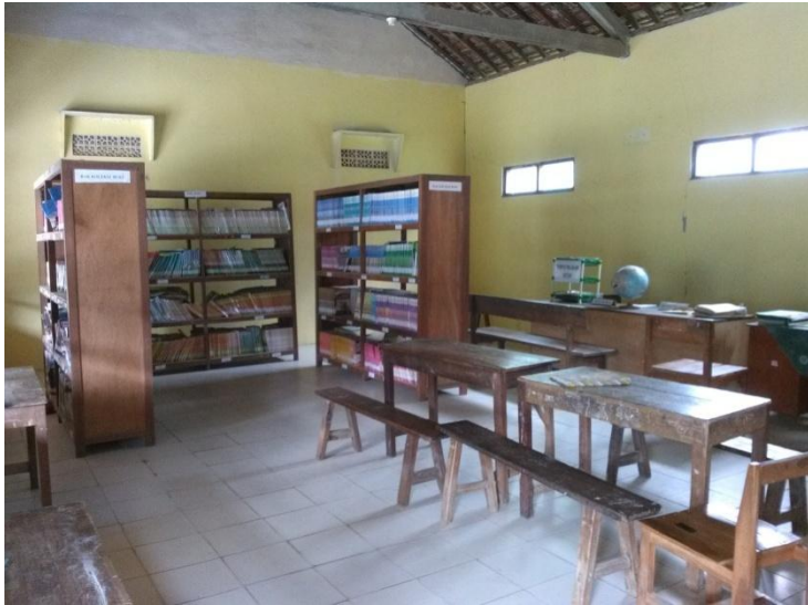
Ruang Perpustakaan MTs. Miftahul Huda Maguan Kaliori Rembang