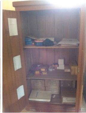
Lab. IPA MTs. Miftahul Huda Maguan Kaliori Rembang