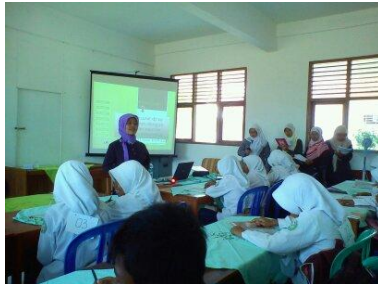
Ruang Belajar MTs. Miftahul Huda Maguan Kaliori Rembang