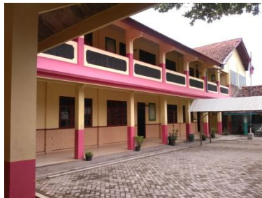
Bangunan Gedung MTs. Miftahul Huda Maguan Kaliori Rembang