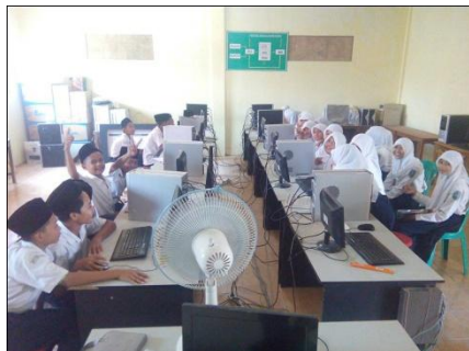
Lab. Komputer MTs. Miftahul Huda Maguan Kaliori