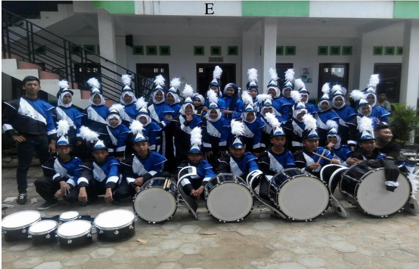
kstrakurikuler Marching Band MTs. Miftahul Huda maguan Kaliori Rembang