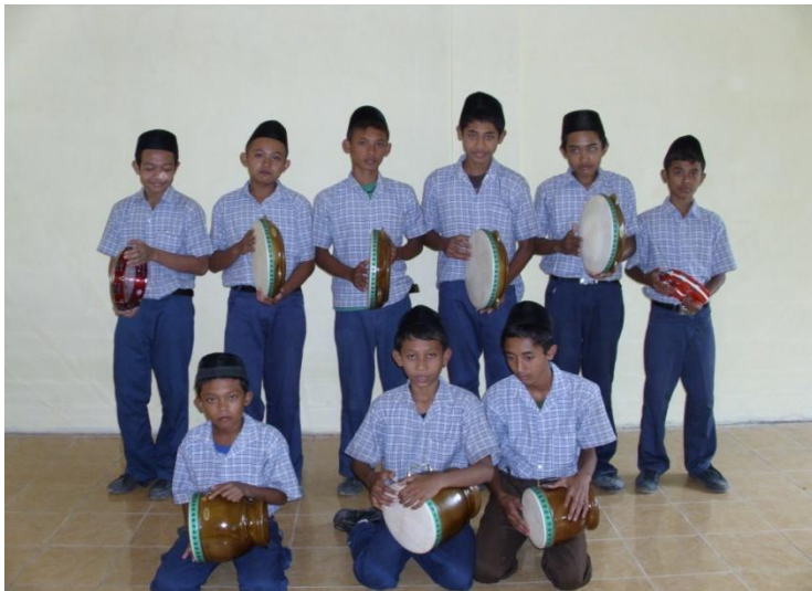
Grup Ekstrakurikuler Rebana MTs. Miftahul Huda Maguan Kaliori Rembang