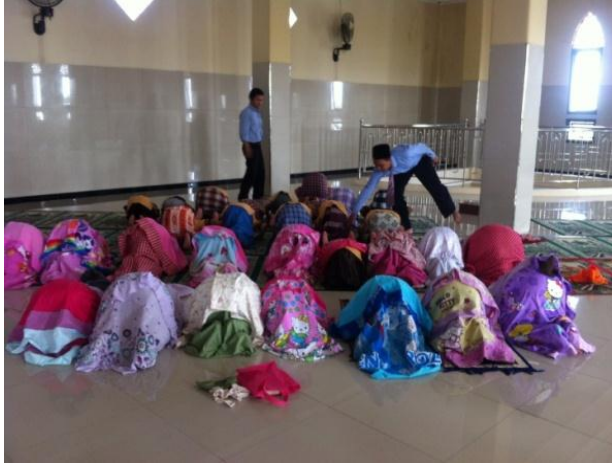
Siswa Kelas 1 Praktek Sholat Dhuha di Masjid