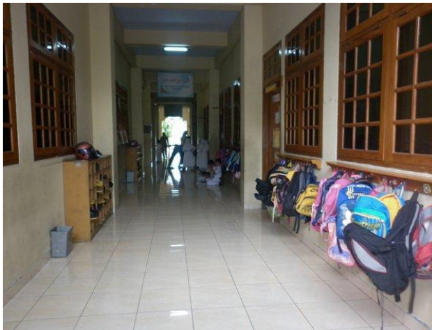
Gedung Berlantai 2 SDI Al-Azhar 25 Semarang