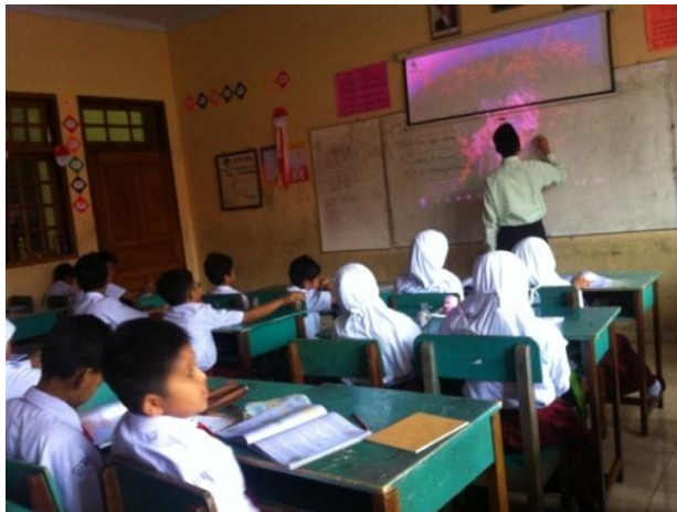
Kegiatan Belajar Mengajar Kelas V