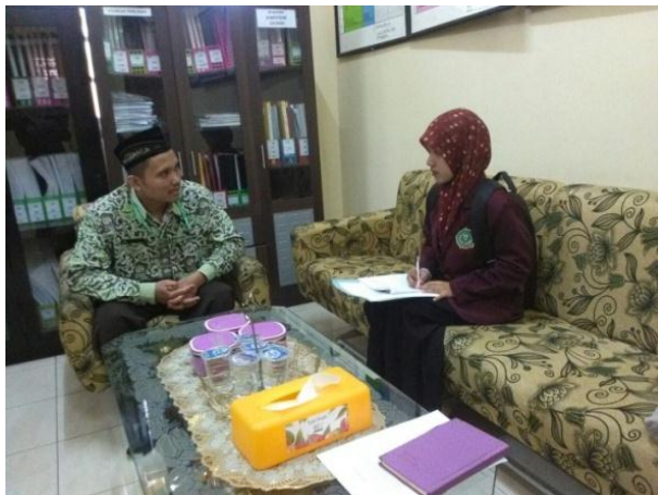
Wawancara dengan Kepala Sekolah SDI Al-Azhar 25 Semarang