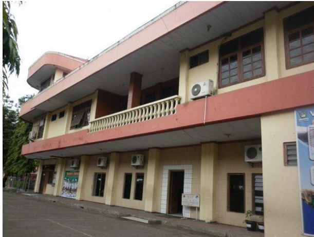
Gedung I SDI Al-Azhar 25 Semarang