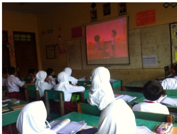
Siswa Menonton Cerita Manfaat Judul Menziarahi Orang Sakit