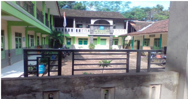
Tampak depan MI Islamiyah Podorejo