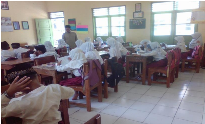
Guru saat menerangkan kepada siswa