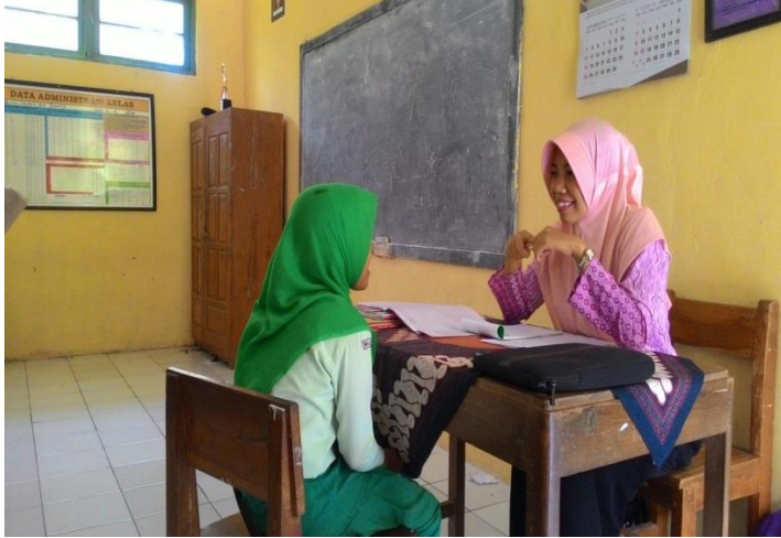
Wawancara dengan siswa kelas V MI Islamiyah Podorejo