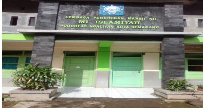
Tampak depan MI Islamiyah Podorejo