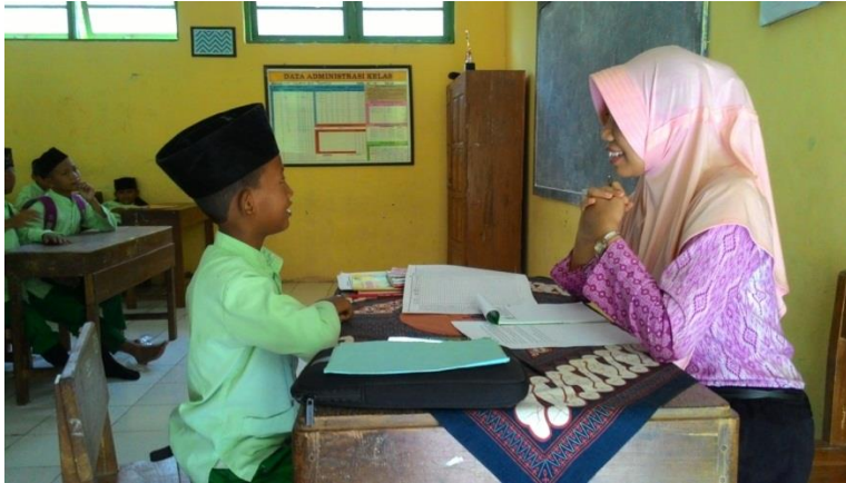
Wawancara dengan siswa kelas V MI Islamiyah Podorejo