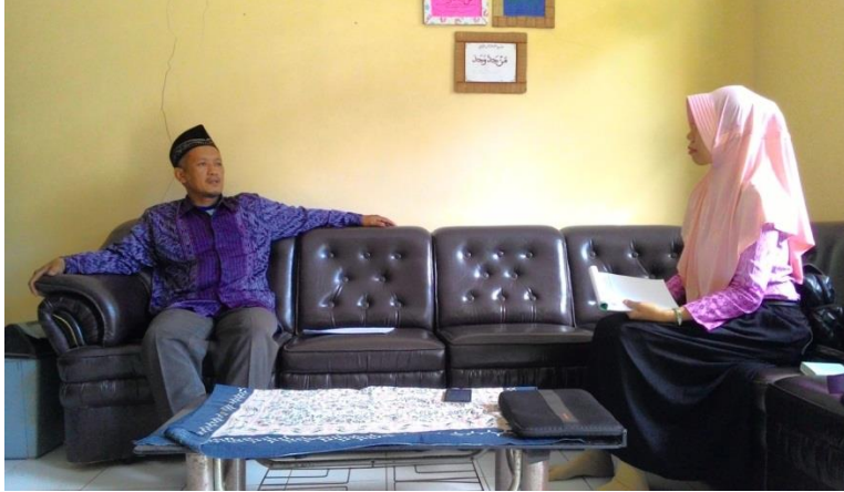
Wawancara dengan guru bahasa Arab kelas V MI Islamiyah Podorejo