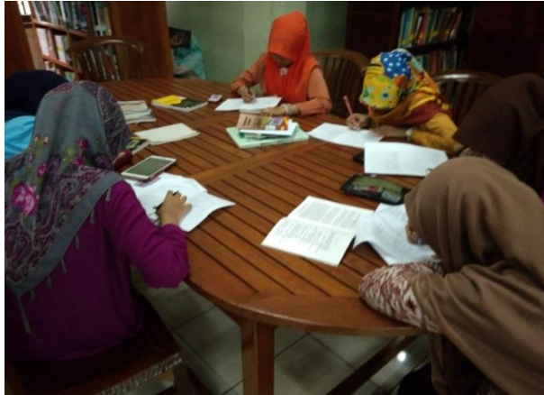
Pemustaka sedang mengisi angket penelitian