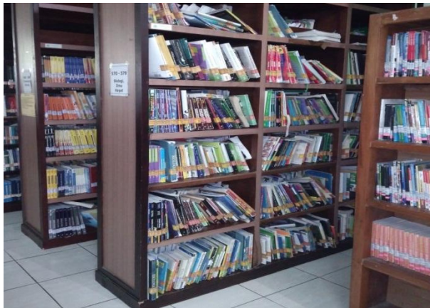
Kondisi rak buku di perpustakaan