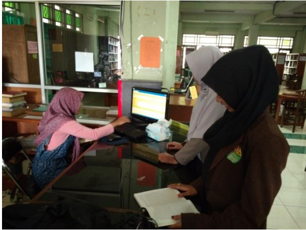
Kegiatan pelayanan di pepustakaan