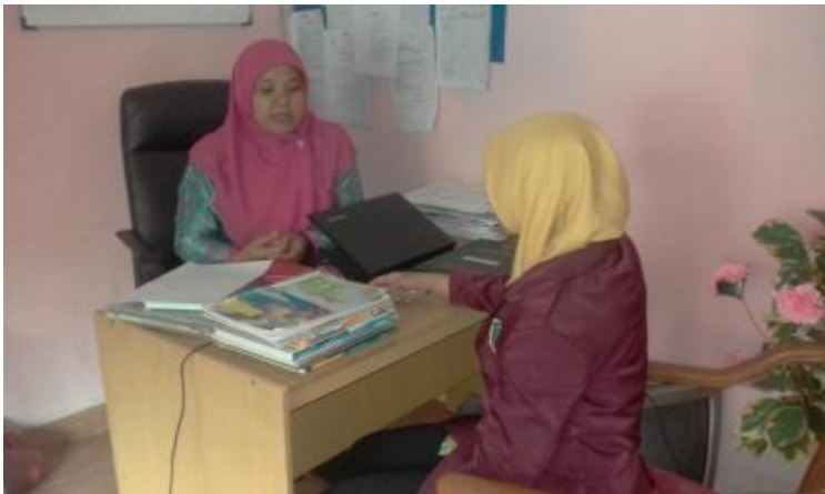
Konsultasi dengan waka kurikulum