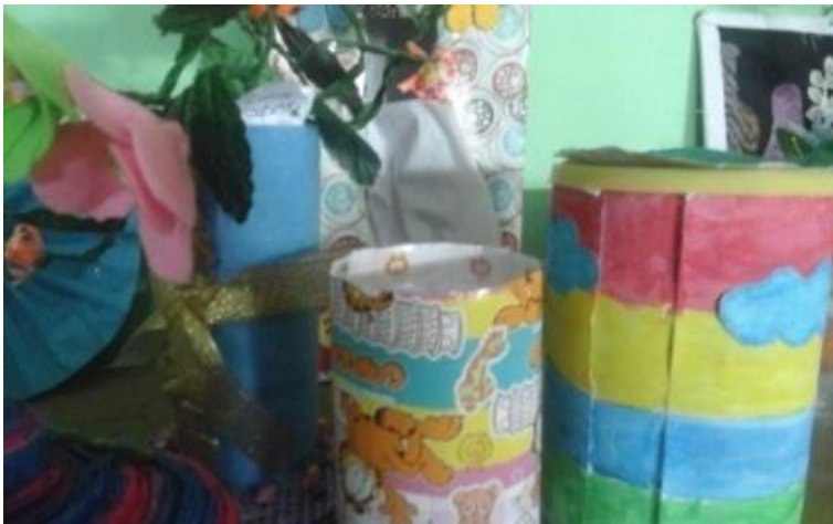
Hasil produk siswa berupa celengan dari barang bekas