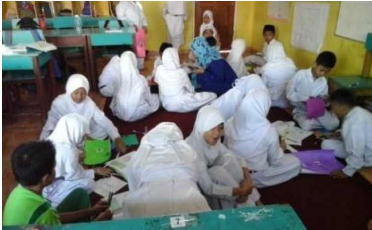
Pelaksanaan penilaian kinerja dan penilaian proyek