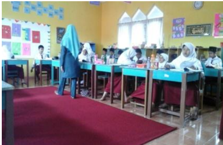
Proses pembelajaran di kelas IV Sulaiman