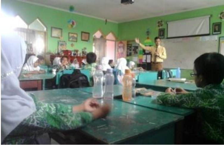
Proses pembelajaran di kelas IV Dzul kifli