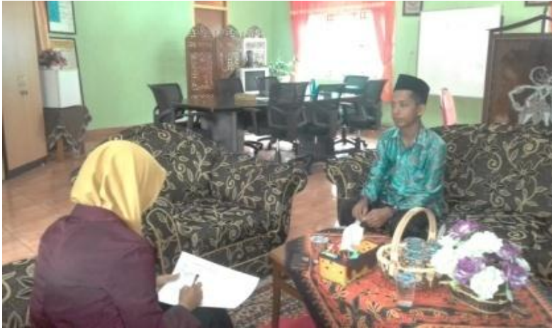
Wawancara kepada kepala SD Islam Al Azhar 29 BSB