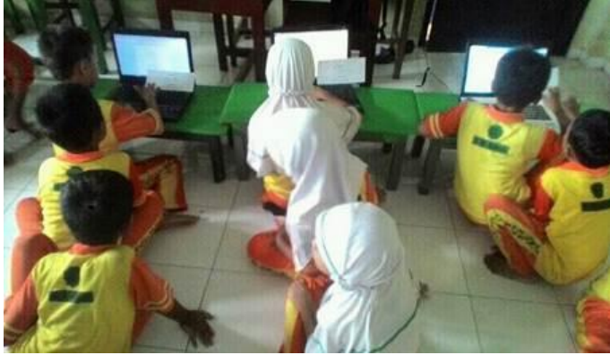
Ketertiban siswa ketika mengerjakan tugas saat pembelajaran