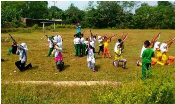
latihan kolone senapan ekstrakurikuler TNI AD Cilik MI Mathalibul Huda