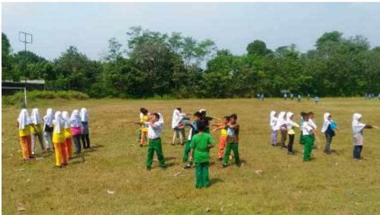
PBB tanpa senapan