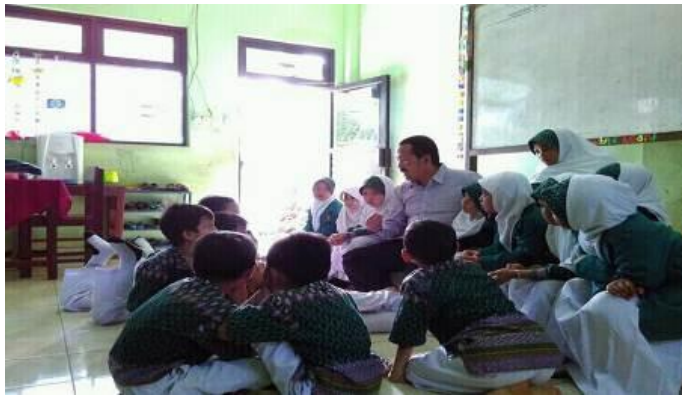
Mendengarkan penjelasan guru ketika pembelajaran