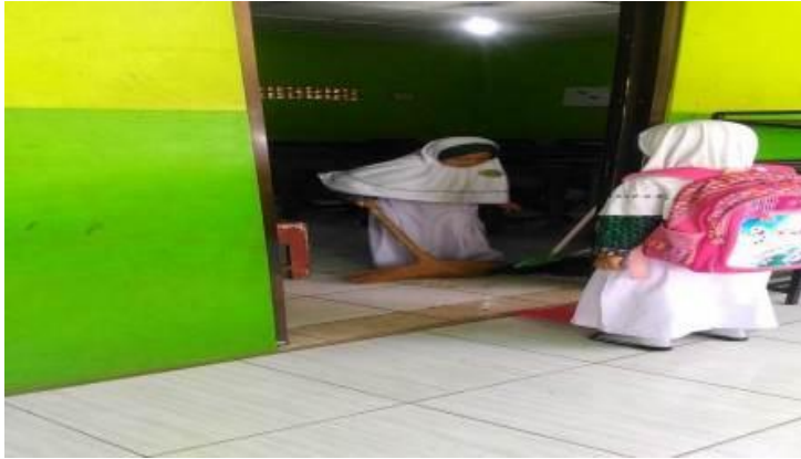
Siswa melaksanakan tugas piket kelas