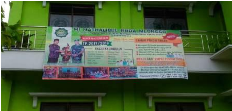
Macam-macam ekstrakurikuler yang ada di MI Mathalibul Huda