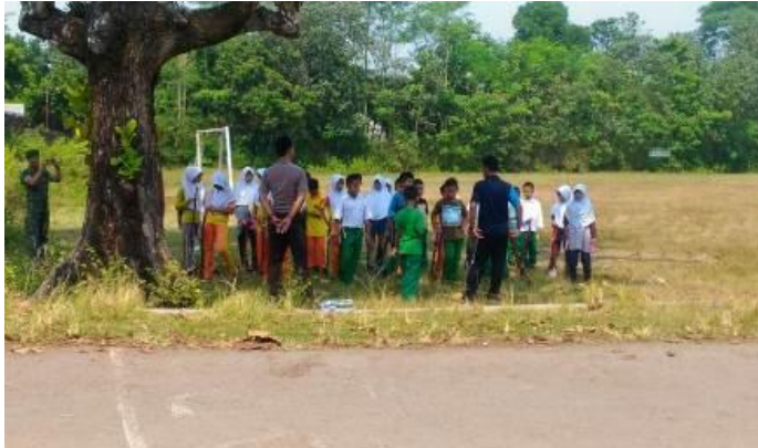
Pelatih memberikan evaluasi latihan dan materi wawasan kebangsaan