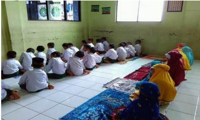
Kedisiplinan siswa mengikuti shalat berjamaah