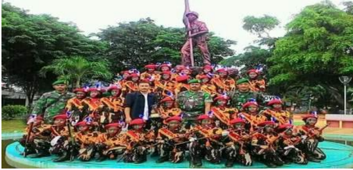
Pasukan TNI AD Cilik (tentara cilik masa depan) beserta pelatih dan kepala madrasah