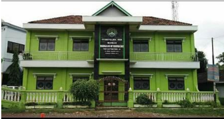
Bangunan MI Mathalibul Huda tampak dari depan