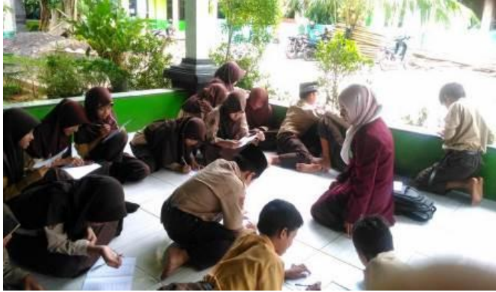
siswa kelas 6 saat mengisi angket uji coba