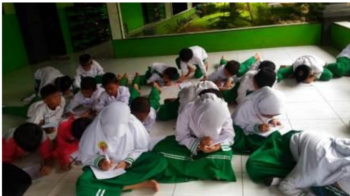
Siswa kelas 2 sampai 5 mengisi angket penelitian