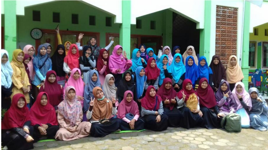
Gambar 2. Mentoring bersama kelompok lain