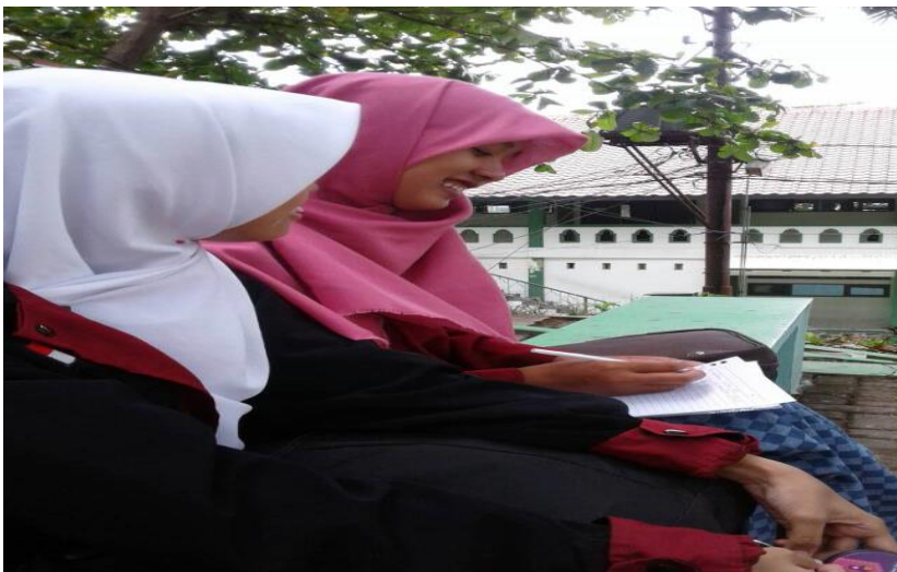
Gambar 1. Wawancara dengan mentor dan peserta mentoring