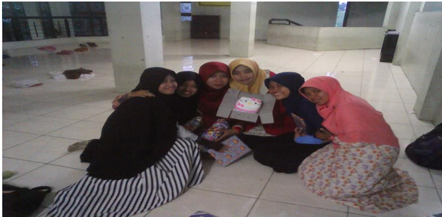
Gambar 3. Keakraban kelompok mentoring dengan mentor dan peserta mentoring