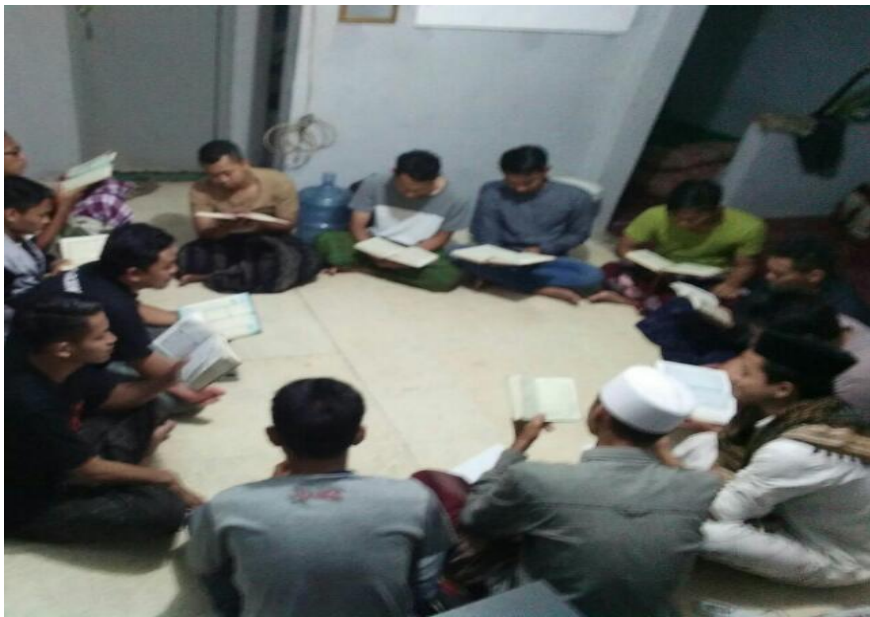
Gambar 4. Kelompok mentoring putra sedang tilawah Al-Qur'an di awal kegiatan mentoring