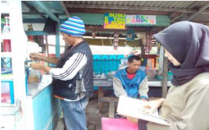
Gambar 2. Wawancara dengan nasabah KSPPS BMT Walisongo