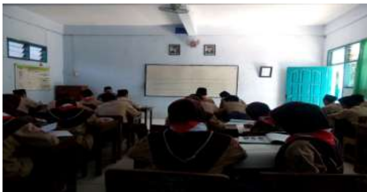
Kegiatan wawancara tanggal 21 oktober 2017