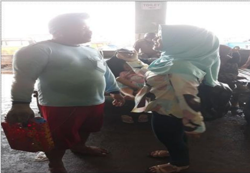
WAWANCARA DENGAN NELAYAN DI TPI TASIK AGUNG REMBANG