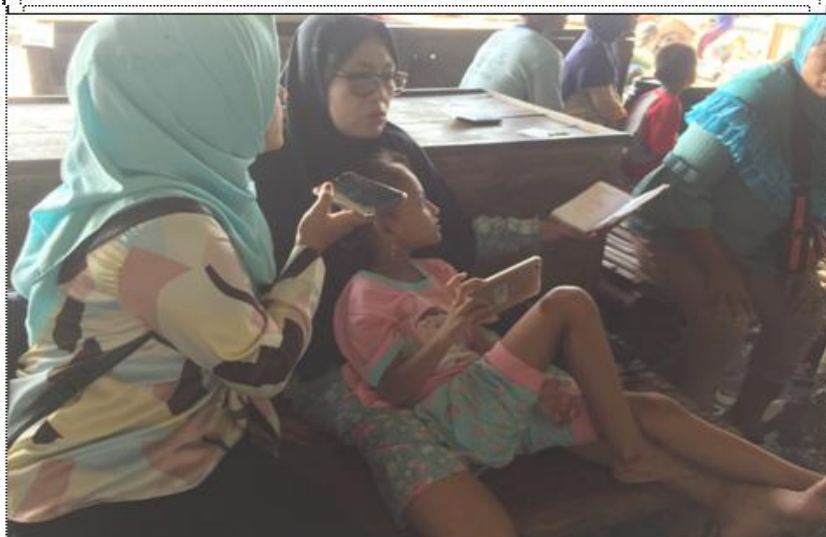
WAWANCARA DENGAN BAKUL (PEMBELI) DI TPI TASIK AGUNG REMBANG