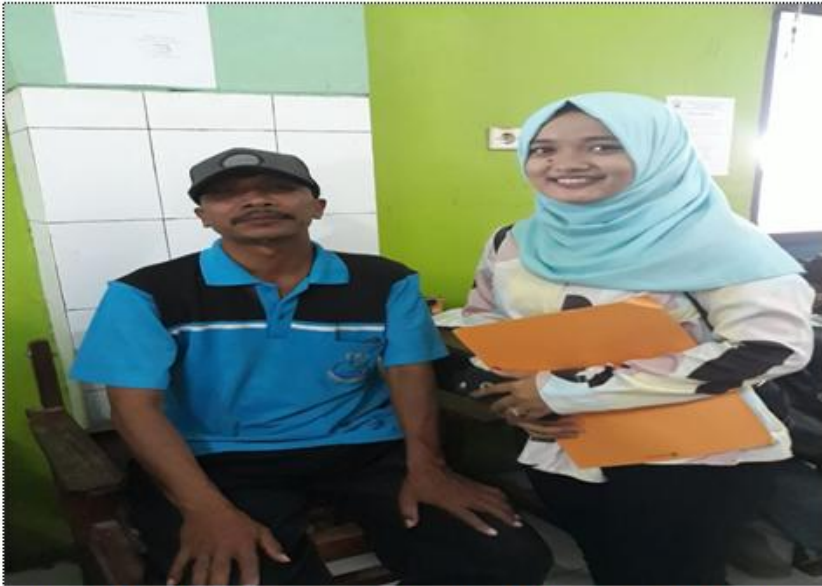
WAWANCARA DENGAN KETUA TPI TASIK AGUNG REMBANG