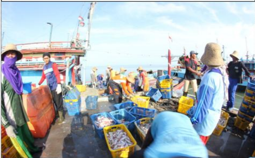
DOKUMENTASI BONGKAR IKAN DARI HASIL TANGKAPAN DI LAUT