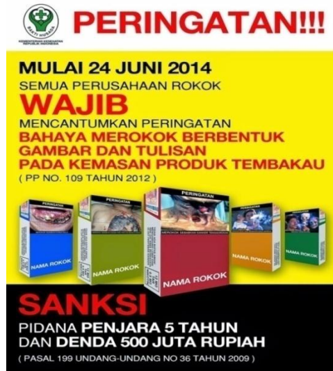
Gambar 1.6 Contoh Iklan Produk Rokok di Media Sosial & Televisi

Dalam iklan di atas menggambarkan bahwa pemerintah mewajibkan kepada semua perusahaan rokok untuk mencantumkan peringatan “ Bahaya Merokok Berbentuk gambar dan tulisan Pada Kemasan Produk Tembakau (PP No. 109 Th 2012) ” dan apabila ada instansi yang melanggar maka akan ada sanksi Pidana penjara 5 tahun dan denda sebesar Rp. 500.000.000 ( Pasal 199 UU No 36 th 2009 ). Disitu tersirat sebuah pesan pada para konsumen supaya hati-hati dalam mengkonsumsi produk tersebut.