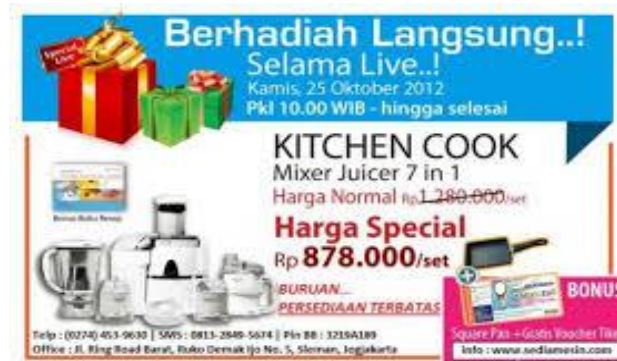
Gambar 1.4 Foto Iklan Berhadiah Langsung di Televisi

internet. Dengan kata lain, tidak ada tempat tanpa keberadaan iklan di dunia ini. Itulah iklan sebagai suatu aktivitas propaganda sekaligus seni yang didesain secara komunikatif untuk membujuk dan mempengaruhi agar membeli produk tertentu.