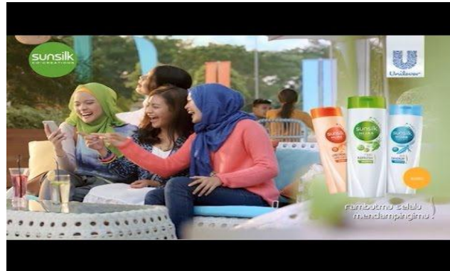
Gambar 1.1 Iklan Cetak Shampo Sun Silk Hijab

Iklan cetak Shampo Sun Silk Hijab menampilkan dua perempuan yang menggunakan hijab dan dua perempuan tidak memakai hijab seperti terlihat gambar di atas semuanya terlihat bahagia. Karena, dalam penyampaian sebuah iklan tersebut menyebutkan “Rambutmu selalu mendampingi” menjadikan mereka lebih percaya diri dalam tampil di publik. Terlebih lagi terhadap perempuan yang berhijab, bukti eksistensi pada dirinya sangat menonjol apabila dia memakai produk tersebut. Akan tetapi, dalam iklan tersebut tidak ditampilkan sosok perempuan yang seksi melainkan kebahagiaan akan kepercayaan pada dirinya.