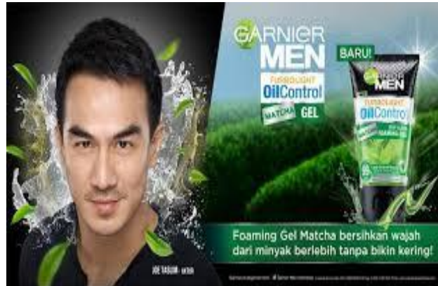
Gambar 1.2 Iklan Cetak Facial Foam Garnier Men ( www.kompasiana.com )

diandag oleh khalayak. Adapun mengenai tampilan iklan laki-laki tidak jauh beda dengan iklan perempuan.