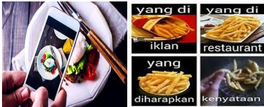
Gambar 1.3 Hasil dan Tampilan Foto Makanan di Internet

Gambar yang ditampilkan di internet telah menciptakan gambaran visual yang dapat berbeda dengan objek sebenarnya, bahkan bisa lebih bagus dibandingkan dengan objek sebenarnya. Hasil foto tersebut menceritakan sebuah makanan yang sedang di potret oleh seseorang dan hasilnya sangat menarik, sehingga jika makanan tersebut di upload di media sosial apalagi itu sebuah makanan yang di promosikan ( endorse ) tidak diragukan lagi makanan tersebut akan dicari dan diburu masyarakat, karena mereka penasaran dengan kelezatan makanan yang ada pada gambar tersebut, terlebih lagi model yang mengiklankan adalah seorang artis yang di idolakannya.