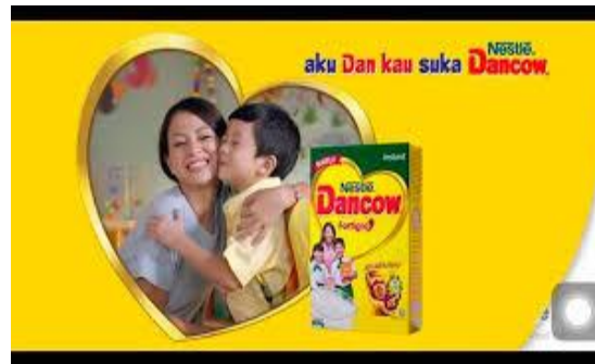
Gambar 1.5 Iklan Produk Susu Anak-anak

lainnya adalah gambar dan gerakan dalam iklan dibuat sedemikian rupa agar mampu menarik perhatian dengan menggunakan model artis dengan gerakan-gerakan badan tertentu sehingga terlihat attractive (menarik).