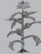
شَجَرَةُ الذُّرَّةِ (Syajaratuz-żurrati)