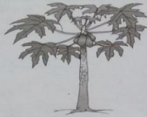
شَجَرَةُ الْبَبَايَا (Syajaratul-bābāyā)