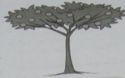
شَجَرَةُ الْبُرْتُقَالِ (Syajaratul-burtuqāli)