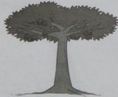
شَجَرَةُ الْمَنْجِسْتَانِ (Syajaratul-manjistāni)